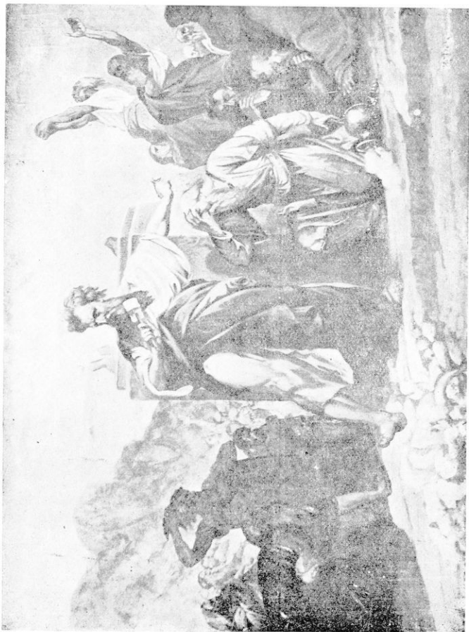
Ὁ Μωϋσῆς κερηνίζων τὰ εἰδῶλα.