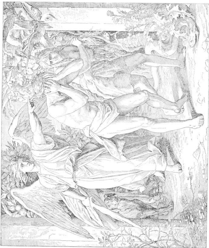
«Καὶ ἐξέβαλε τὸν Ἀδάμ, καὶ κατέφισεν αὐτὸν ἀπέναντι τοῦ παραδείσου τῆς τροφῆς» Γεν. γ' 24.