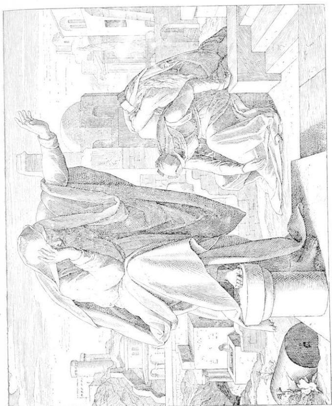
«Ὁρφανοὶ ἐγενήθημεν, οὐχ' ὑπάρχει πατήρ, μητέρες ἡμῶν ὡς αἱ χήραι» (Θρηνητοὶ Ἱερειμ. ε' 3).