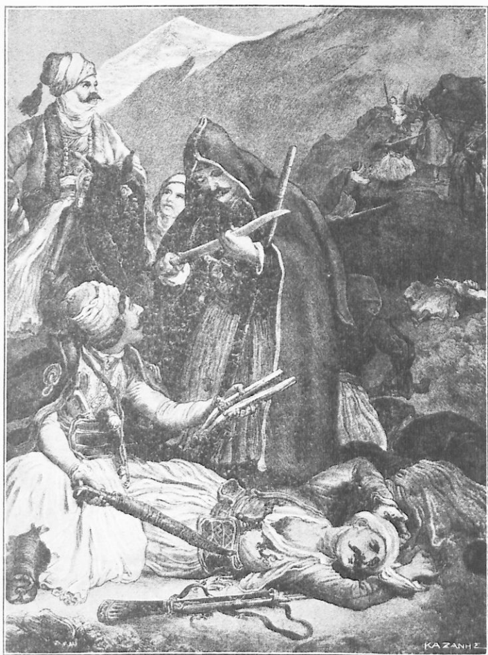
Ὁ Καρυϊσκάκης καταστρέφει τοὺς Τούρκους ἐν Ἀραχώβη