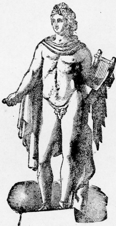
Ἀπόλλων μὲ τὴν φόρμιγγα.

ξαν. Ἐπειτα ἐκάθισε μακρὰν τῶν πλοίων καὶ ἀφῆκε βέλος. Δεινῶς δὲ ἤχησε τὸ ἀργυροῦν τόξον. Καὶ πρῶτον μὲν ἐφόνευε τοὺς ἡμιόνους καὶ τοὺς ταχεῖς κύνας, ἔπειτα δὲ κατηύ-