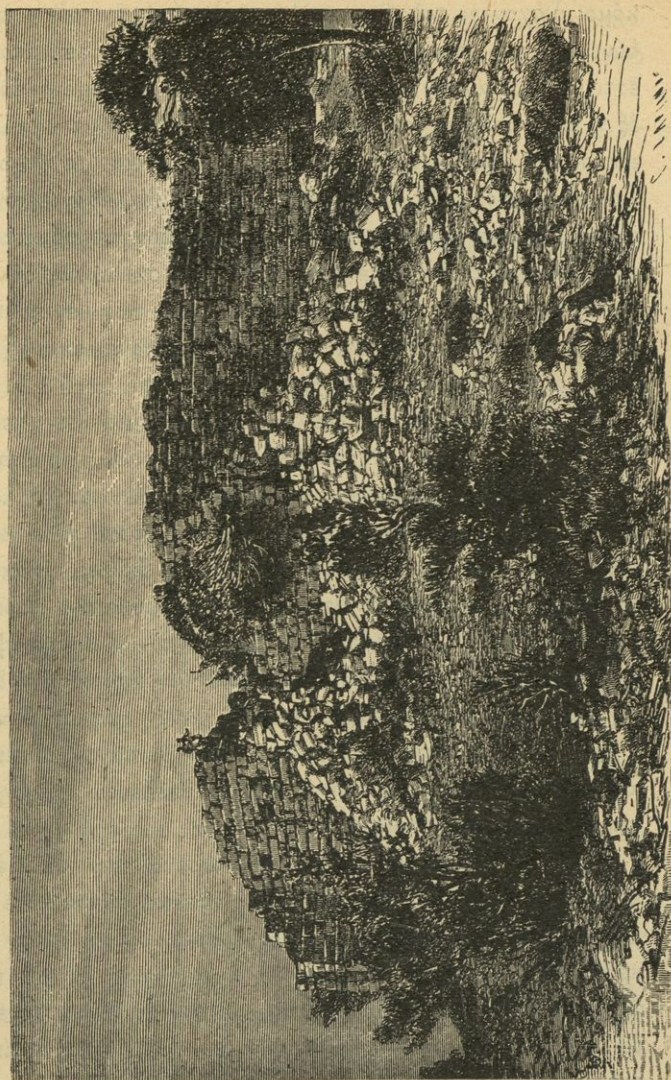
Τὸ φρούριον τῆς Φυλῆς.

Εἰς Ἑλλην. βιβλ. II, κεφ. 4, § 2 καὶ ἐξ.