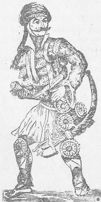
Ὁ Γεώργιος Ἄνδρουτσοσ

Τότε καὶ ὁ συμπολεμιστὴς του ὁ Ἄνδρουτσοσ μαζί μὲ τὰ πηλκάρια του ἔφυγε ἀπὸ τὴ Μάνη καὶ σὲ 40 ἡμέρες καὶ νύχτες πολεμώντας ἀδιάκοπα μὲ τοὺς Τούρκους, πού τὸν καταδίω-