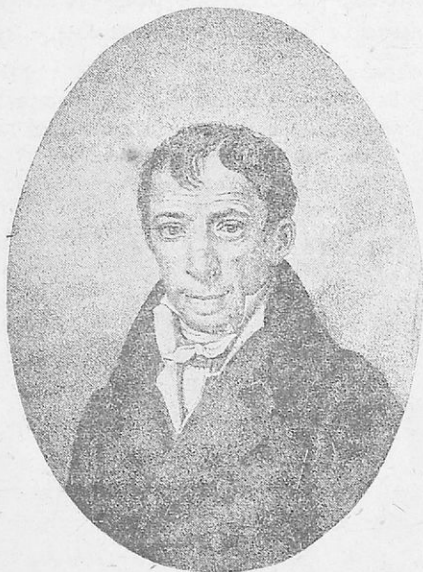
Ὁ Ἀδαμάντιος Κοραῆς

Κατόπιν ἦρθε στὸ Μπομπελιέ τῆς Γαλλίας καὶ σπούδασε