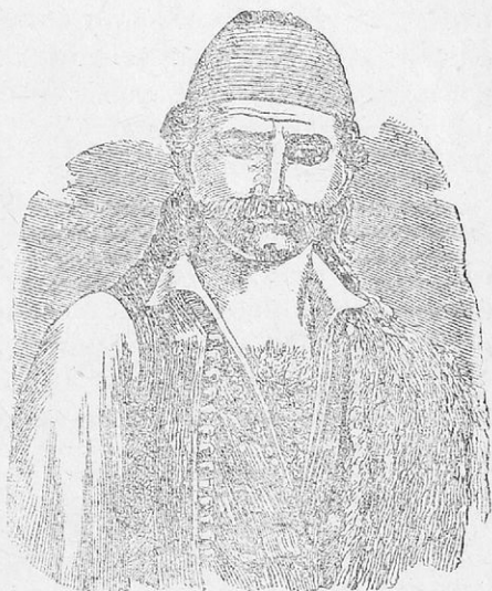
Ὁ Ὀδυσσεύς Ἀνδροῦτσος

Μόλις φάνηκαν οἱ Τούρκοι ὁ τολμηρὸς Ὀδυσσεύς λέει στὰ παληκάρια του: «Ὅποιος θέλει νὰ μὲ ἀκολουθήσῃ ἄς πιαστῇ στὸ χορὸ» κι ἄρχισε τὸ τραγοῦδι: «Κάτω στοῦ Βάλτου τὰ χωριά». Ἀμέσως πιάστηκαν πίσω του 100 παληκάρια καὶ μῆκαν χορεύοντας μέσα στὸ χάνι. Ἐκλείσαν γρήγορα μὲ πέτρες τὰ παράθυρα καὶ τίς πόρτες κι ἄνοιξαν ὀλόγυρα πολεμιστρες.