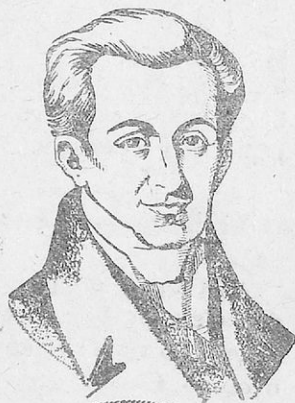
Ὁ Ἰωάννης Καποδίστριας

Ὁ Καποδίστριας ἦταν εὐγενικὸς, ἐργατικὸς καὶ πολὺ ἱκανὸς διπλωμάτης. Γιὰ ὅλα αὐτὰ οἱ Ἕλληνας τὸν εἶχαν σὲ μεγάλη ἐκτίμηση. Στὰ 1822 παραιτήθηκε ἀπὸ ὑπουργὸς τῆς Ρωσσίας καὶ ζοῦσε στὴν Ἐλβετία. Ἡ Γ' Ἐθνικὴ συνέλευση ἀναγνωρίζοντας τὴν ἀξία του τὸν ἐξέλεξε κυβερνήτη τῆς χώρας καθὼς εἶδαμε.