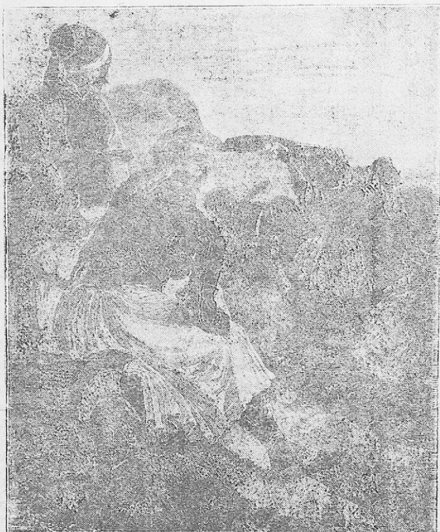
Ο Θεόδωρος Κολοκοτρώνης

Ο Κολοκοτρώνης είχε όλα τα χαρίσματα του καλού άρχηγού. Το άνόστημά του και οι τρόποι του άμέσως σέ γοήτευαν. Το πρόσωπό του ήταν μελαψό, το βλέμμα του άτρόμητο και τα μαλλιά του μακριά, χυμένα στους ώμους. Η βρον-