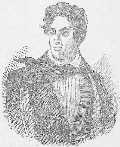
Ὁ λόρδος Μπάϊρον

Ἀλλά δυστυχῶς τὸ ὑγρὸ κλίμα τοῦ Μεσολογγίου ἔβλαψε τὴν ὑγεία τοῦ ἀσυνήθιστου λόρδου. Ὁ συνεχῆς πυρετὸς τὸν ἐξασθένησε, πάρα πολὺ. Τέλος τὸ βράδυ στίς 7 Ἀπριλίου 1824, ὁ μεγάλος φιλέλληνας παρέδωκε τὸ πνεῦμα. Τὴν ἄλλη μέρα τὸ πρωὶ με τὴν ἀνατολὴ τοῦ ἡλίου 38 κανονιές, ὅσα ἦταν καὶ τὰ χρόνια τοῦ νεκροῦ ποιητῆ, ἀνάγγειλαν τὸ μεγάλο δυστύχημα.