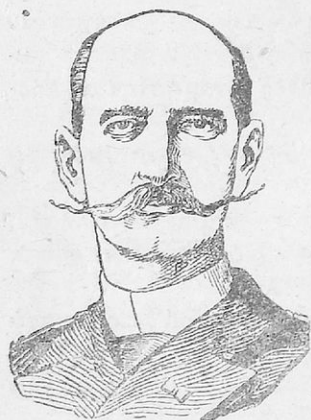
Ο Γεώργιος ο Α΄

φωνα βασιλιά της Ελλάδας το Γεώργιο, τον πρίγκιπα της Δανίας. Ο νέος βασιλιάς έφτασε στην Αθήνα τον Οκτώβριο του 1863 και μπροστά στην Έθνοσυνέλευση ώρκίστηκε, πως θα φυλάξει το συνταγματικό πολίτευμα .