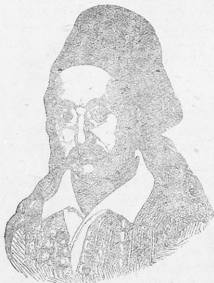
Ο Μάρκος Μπότσαρης

Οι Σουλιώτες τότε καταλυπημένοι σταμάτησαν τον άγώνα πήραν το σώμα του άλησμόνητου άρχηγού τους και το μετέφεραν στο Μεσολόγγι. Έκει το έθαψαν με μεγάλες τιμές. Ο θάνατος του ήρωϊκού Σουλιώτη άπλωσε βαρύ πένθος σ' όλόκληρη την Ελλάδα,