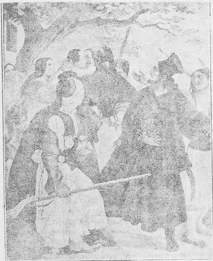
Ὁ Ἀθανάσιος Διάκος

πώς ξέρουν νά πολεμοῦν γιά τήν ἐλευθερία. Συνενοήθησαν λοιπόν ὁ Πανουργιάς, ὁ Δυοβουνιώτης κι ὁ Διάκος, νά μὴν ἀφήσουν τοὺς Τούρκους νά κατεβοῦν στήν Πελοπόννησο γιά νά βοηθήσουν τὴν Τρίπολη, πού ἦταν ἀκόμη σέ πολιορκία.