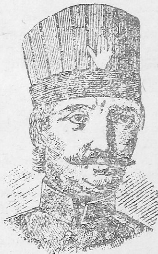
Ὁ Λάμπρος Κατσώνης

Ὁ Κατσώνης γεννήθηκε στὴ Λειβαδιά. Πολὺ νέος ἔλαβε μέρος στὴν ἐπανάσταση τοῦ 1770. Ὕστερα πῆγε στὴ Ρωσσία, ὅπου κα-