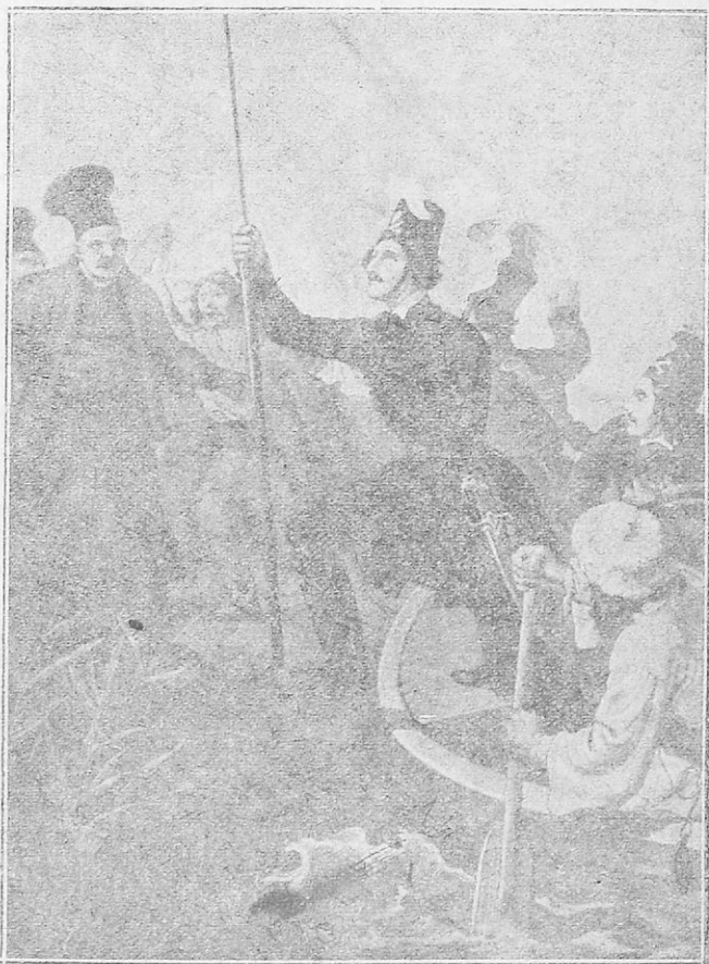
Ὁ Ὑψηλάντης ὑψώνει τὴ σημαία τῆς ἐπανάστασεως.

Ἐκ τῆς Κίεβο ὁ Ὑψηλάντης κατέβηκε στὴ Βεσσαραβία γιὰ νὰ ἐτοιμάσῃ τὸ στρατηγικὸ του σχέδιο, νὰ συνεννοηθῇ μὲ τοὺς φιλικούς καὶ νὰ εἶναι πιὸ κοντὰ στὶς ἑλληνικὰς χώρες. Μετὰ 8