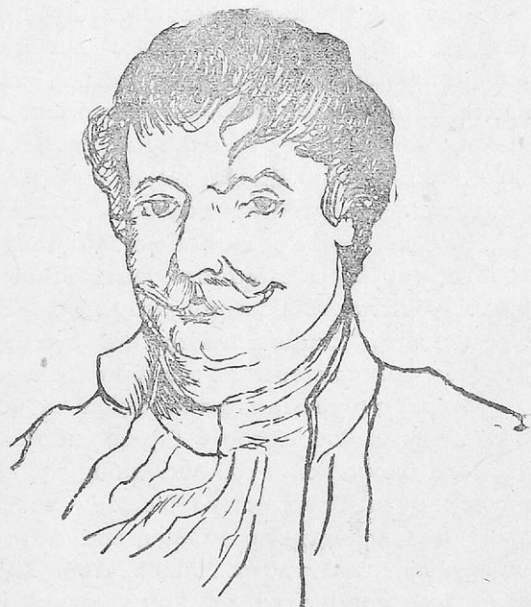
Ὁ Ρήγας Φεραῖος

Στὰ χρόνια τῆς σκλαβιάς δὲν ἦταν μονάχα τὸ κάρυοφίλι τοῦ κλέφτη ποὺ βροντοῦσε καὶ τάραζε τοὺς Τούρκους. Ὑπῆρχε κοντὰ σ' αὐτὸ καὶ ἡ πέννα τῶν μορφωμένων Ἑλλήνων, ὄπλο φοβερὸ κατὰ τῶν τυράννων. Οἱ λόγοι, τὰ βιβλία καὶ οἱ προκηρύξεις τους ἐξάπλωναν τὴν ἰδέα τῆς ἀπελευθέρωσης, ἔδιναν θάρρος στοὺς ραγιάδες καὶ τοὺς διαφώτιζαν ν' ἀγαποῦν καὶ νὰ πιστεύουν στὴν πατρίδα.