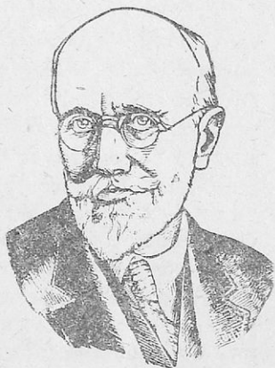
Ὁ Ἐλευθέριος Βενιζέλος

Ὁ Βενιζέλος πραγματικὰ ἀναδείχτηκε ἄξιος γιὰ τὸ ἔργο