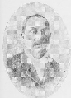
Θ. ΡΑΛΛΗΣ 1871 - 1885