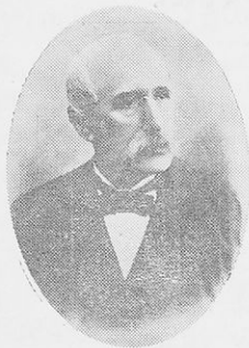
Γ. ΑΒΕΡΩΦ 1885 - 1899