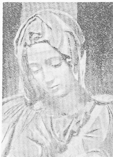
Ἡ Πιετὰ τοῦ Μιχ. Ἀγγέλου