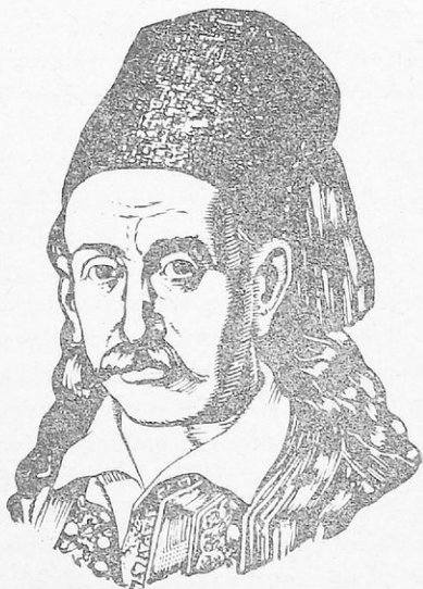
Μάρκος Μπότσαρης (1790 - 1823).

Κατὰ τὴν περίοδον αὐτὴν οἱ Ἕλληνες ἀρχηγοὶ ἤριζον διὰ τὰ πρωτεῖα καὶ ἡ Κυβέρνησις ἔστειλε διπλώματα ἀρχιστρατηγίας εις ἄλλους τοὺς ὄπλαρχηγούς. Ἄλλ' ὁ Μάρκος Μπότσαρης ἔσχισε τὸ δίπλωμα τῆς ἀρχιστρατηγίας καὶ ἐπικεφαλῆς 350 ἐνόπλων ἐβάδισε πρὸς τὸ Καρπενήσι ὅπου εὗρισκετο ἡ προφυλακὴ τοῦ στρατοῦ τοῦ Μουσταῆ πασᾶ, 4.000 στρατιῶται ὑπὸ τὸν Τζελαλεδὶν Βέην. Ὁ Μάρκος Μπότσαρης ἐπετέθη αἰφνιδιαστικῶς ἐναντίον των καὶ ἐπέφερεν εἰς αὐτοὺς μεγάλας ἀπωλείας (800 ἐφονεύθησαν καὶ τὸ σῶμα τῆς προφυλακῆς διελύθη). Εἰς τὴν μάχην αὐτὴν ἔπεσεν ἡρωϊκότετα καὶ ὁ Μάρκος Μπότσαρης. Τὸν θάνατόν του ἐθρήνησε ὁ ἔθνικὸς ποιητῆς Διον. Σολωμὸς. Μετὰ τὸν θάνατον τοῦ Μάρκου Μπότσαρη οἱ δύο πασᾶδες ἐπολιορκήσαν τὸ Αἰτωλικόν, ἀλλὰ ἡ πολιορκία των ἀπέτυχεν χάρις εἰς τὴν ἀντίστασιν τῶν πολ-