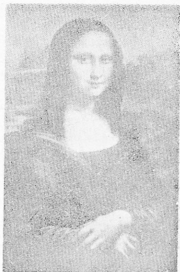
Τζιοκόντα (Λεονάρδο ντὰ Βίντσι). Μουσείον Λούβρου. Παρίσιοι).

τάβασις τῶν Ἑλλήνων σοφῶν ἀπὸ τῆν ἑλληνικὴν ἀνατολήν εἰς τὴν δύσιν, εἰς τὴν ὁποίαν μετέφερον τὰς γνώσεις των καὶ τὴν σοφίαν των. Οἱ Ἕλληνες κατέφευγον ἐκεῖ διὰ νὰ ἀποφύγουν τὸν τουρικὸν κίνδυνον καὶ ἔφερον μαζί των καὶ τὰ συγγράμματα τῶν ἀρχαίων Ἑλλήνων σοφῶν. Μεγάλοι ἐπίσης συγγραφεῖς καὶ ποιηταὶ τῆς ἐποχῆς αὐτῆς ἦσαν ὁ Ἄγγλος Οὐίλλιαμ Σαίξπηρ, ὁ Ἰσπανὸς Θεοβάλντες καὶ ὁ Γάλλος Φρ. Βιγιόν.