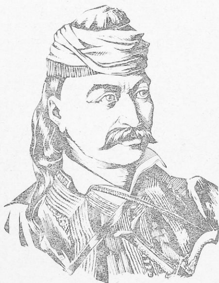
Ὁ Θ. Κολοκοτρώνης.