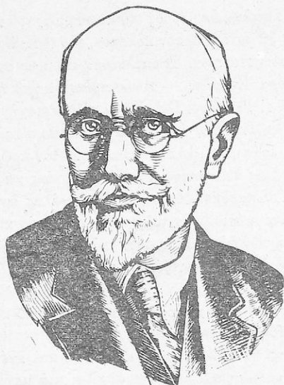
Ἐλευθέριος Βενιζέλος (1864 - 1936)

ἀπὸ κοινοῦ τὸν πόλεμον κατὰ τῆς Βουλγαρίας. Οἱ Βούλγαροι εἶχον δώσει μάλιστα πρῶτοι τὴν ἀφορμὴν τοῦ πολέμου αὐτοῦ διότι ἐπετέθησαν κατὰ τῶν Ἑλλήνων καὶ Σέρβων εἰς τὴν Γευγελῆν αἰφνιδιαστικῶς τὴν 17 Ἰουνίου 1913. Ὁ Ἑλληνικὸς στρατὸς ἐπετέθη καὶ εἰς τὴν μάχην μεταξὺ Κιλικίας καὶ Λαχανᾶ (19 Ἰουλίου) συνέτριψε τοὺς Βουλγάρους. Κατόπιν οἱ Ἕλληνες καταδιώκοντες τοὺς Βουλγάρους τοὺς ἐνίκησαν εἰς τὴν μάχην τῆς Κρέσνας (8—11 Ἰουλίου) καὶ τὴν μάχην τῆς Τζουμαγιάς (12 Ἰουλίου). Ἐν τῷ μεταξὺ ὁ ἑλληνικὸς στόλος κατέλαβεν τὴν Ἀλεξανδρούπολιν. Ἀπὸ τὴν ἄλλην πλευρὰν οἱ Σέρβοι προήλθον ἐντὸς τῆς Βουλγαρίας καὶ ἐν τῷ μεταξὺ οἱ Τούρκοι ἀφοῦ ἐκήρυξαν ἄκυρον τὴν συνθήκην τοῦ Λονδίνου ἀνεκατέλαβον τὰς Σαράντα ἐκκλησίας καὶ τὴν Ἀδριανούπολιν, εἰσέβαλον δὲ ἀπὸ βορρᾶ καὶ οἱ Ρουμάνοι. Ἡ Βουλγαρία ἀπειλεῖτο πανταχόθεν. Τότε ἐζήτησεν συνθηκολόγησιν καὶ αἱ ἐχθροπραξίαι κατέπαυσαν τὴν 17ην Ἰουλίου ὁπότε καὶ ὑπεγράφη ἀνακωχὴ μεταξὺ τῶν ἐμπολέμων. Κατόπιν συνήλθον εἰς τὸ Βουκουρέστιον οἱ ἀντιπρόσωποι τῶν ἐμπολέμων, οἱ ὅποιοι συνεφώνησαν κατόπιν πολλῶν διαπραγματεῦ-