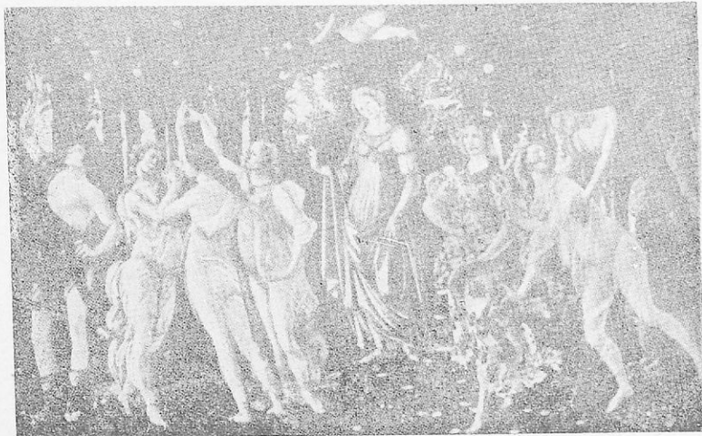
Ἡ ἄνοιξις (Μποττιτσέλλι - Φλωρεντία, Ἀρχαία Πίνακοθήκη).

Κατὰ τὸ τέλος τοῦ μεσαιῶνος καὶ τὴν περίοδον τῆς Ἀναγεννήσεως ἔζησαν μεγάλοι ποιηταὶ καὶ συγγραφεῖς οἱ σημαντικώτεροι ἀπὸ τοὺς ὁποῖους εἶναι οἱ ἰταλοὶ Πετράρχης, Βοκκάκιος καὶ Δάντης. Ὁ Δάντης θεωρεῖται ἕνας ἀπὸ τοὺς μεγάλους ποιητὰς τοῦ κόσμου. Ἡ Ἀναγέννησις εἶναι μία ἀπὸ τὰς μεγάλας ἐποχὰς τοῦ ἀνθρωπίνου πολιτισμοῦ, καὶ μία ἀπὸ τὰς βασικώτερας αἰτίας τῆς ἦταν καὶ ἡ με-