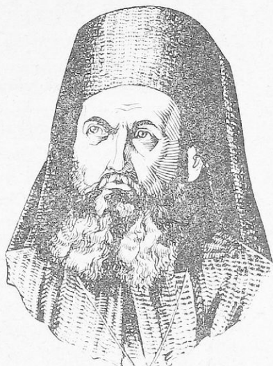
Ὁ Πατριάρχης Γρηγόριος Ε΄.