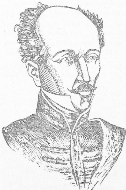
Ἄλέξανδρος Ὑψηλάντης (1792-1826).

Ἡ ἔναρξις τῆς ἐπαναστάσεως ἀπὸ τὰς παραδουναβίους ἡγεμονίας ἀπεφασίσθη διότι ἐκεῖ ὑπῆρχε πολὺς ἑλληνικὸς πληθυσμὸς καὶ ἐπὶ πλέον ἀπηγορεύετο νὰ εἰσέλθῃ, θάσει τῶν συνθηκῶν, τουρκικὸς στρατός. Ἀκόμη οἱ ἡγεμόνες τῶν περιοχῶν αὐτῶν ἤσαν Ἕλληνας καὶ ὑπῆρχε ἐλπίς νὰ βοηθήσουν καὶ οἱ ἐντόπιοι, οἱ ὁποῖοι ἀντιπαθοῦσαν τοὺς Τούρκους.