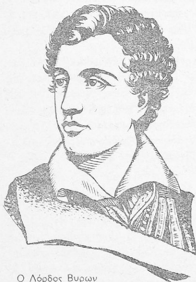
Ο Λόρδος Βυρων

θίας ἔπου συνεδρίαζον διὰ τὴν ἐπανάστασιν τῆς Νεαπόλεως. Ἀλλὰ οἱ ἀγριότητες τῶν Τούρκων ἰδίως ὁ ἀπαγχονισμὸς τοῦ πατριάρχου ἤρχισαν νὰ ἀλλάσουν τὸ κλίμα ὑπὲρ τῶν Ἑλλήνων. Ἡ Ρωσικὴ κυβερνήσις παρακινουμένη ἀπὸ τὸν Ἰωάν. Καποδίστριαν ἔστειλεν τελεσίγραφον πρὸς τὴν Τουρκίαν, εἰς τὸ ὁποῖον ἐτίθετο τὸ ζήτημα τῆς συνυπάρξεως τῆς Ὀθωμανικῆς αὐτοκρατορίας μὲ τὰς Χριστιανικὰς δυνάμεις τῆς Εὐρώπης. Τὸ ζήτημα τοῦτο εἶχε φέρει εἰς κρίσιμον σημεῖον τὰς σχέσεις Ρωσίας καὶ Τουρκίας, ἀλλ' αἰφνιδίως, ἡ Ρωσία ἤλλαξε στάσιν ἐναντίον τῶν Ἑλλήνων, ἐπηρεασμένη ἀπὸ τὸν Μέττερνιχ. Ὁ Καποδίστριαν ἀντελήφθη ὅτι δὲν ἦτο πλέον δεκτὸς εἰς τὴν ρωσικὴν αὐλὴν καὶ ἀφοῦ ἐζήτησε ἀπεριόριστον ἄδειαν ἀπεχώρησε. Ἀλλὰ ἀπὸ τοῦ ἔτους 1823 ἡ στάσις τῶν μεγάλων δυνάμεων ἤρχισε νὰ ἀλλάσῃ ὑπὲρ τῶν Ἑλλήνων.