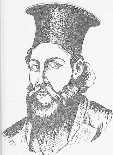
Ο Παλαιών Πατρῶν Γερμανός (1771 - 1826).