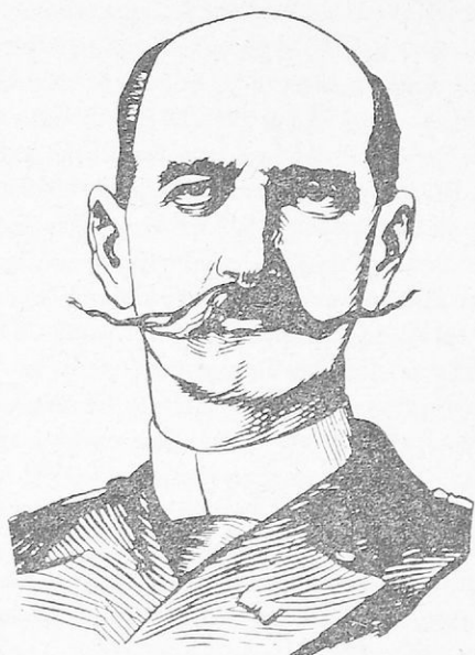
Ὁ βασιλεὺς Γεώργιος Α' (1845 - 1913).

ἐκ τῆς Κρήτης τοῦ Ἐλευθερίου Βενιζέλου, ὁ ὁποῖος εἶχεν διακριθῆναι εἰς τοὺς ἀγῶνας τῶν Κρητῶν διὰ τὴν ἐλευθερίαν των, ἐγένετο ἡ ἀναθεώρησις τοῦ συντάγματος τοῦ 1864, διὰ νέων διατάξεων, αἱ σημαντικώτεραι τῶν ὁποίων ἦτο ἡ ἴδρυσις ἐκλογοδικείου καὶ ἡ μονιμότης τῶν δημοσίων ὑπαλλήλων. Ἡ ἀναθεώρησις αὕτη ἐγένετο τὸ 1911. Κατόπιν τῆς διεξαχθείσας ἐκλογῆς ἐκέρδισεν τὸ κόμμα τῶν φιλελευθέρων, τὸ κόμμα δηλ. τοῦ Ἐλ. Βενιζέλου, ὁ ὁποῖος ἀπὸ τῆς πρώτης στιγμῆς τῆς ἀφίξεώς του ἐκ τῆς Κρήτης ἔδειξεν τὰ μεγάλα ἡγετικά του προσόντα, ὡς καὶ τὴν πολιτικὴν του εὐθυκρίσιαν. Τὸ 1912 ἦτο λοιπὸν πρωθυπουργὸς τῆς Ἑλλάδος ὁ Ἐλ. Βενιζέλος καὶ τότε ἤρχισεν νὰ γίνεταί λόγος περὶ συνεννοήσεως τῶν χριστιανικῶν κρατῶν τῆς Βαλκανικῆς. Ἀφορμὴν εἰς τοῦτο ἔδωκεν ἡ πολιτικὴ τῶν Νεοτούρκων οἱ ὁποῖοι τὸ 1908 εἶχον κάμει ἐπανάστασιν εἰς τὴν Τουρκίαν μὲ σκοπὸν νὰ ἀνανεώσουν τὴν πολιτικὴν τῆς ζωῆς καὶ οἱ ὁποῖοι ἐκτὸς τῶν ἄλλων ἠκολούθουν πολιτικὴν βιαίου ἐκτουρκισμοῦ τῶν χριστιανικῶν λαῶν τῆς Ὀθωμανικῆς αὐτοκρατορίας. Τὴν ἐπο-