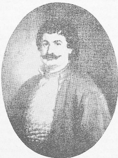
Ρήγας ὁ Φεραῖος.

γραμματεὺς τοῦ ἡγεμόνος τῆς Βλαχίας. Ἀπὸ ἐκεῖ ἀρχίζει τὴν προσπάθειάν του διὰ τὴν ἀπελευθέρωσιν τῶν Ἑλλήνων καὶ εἰργάζετο μὲ ἐνθέρμον ζῆλον. Ἀργότερα ἐγκατεστάθη εἰς τὴν Βιέννην, ὅπου εὕρισκετο μεγάλη ἑλληνικὴ παροικία καὶ ἐκεῖ ἤρχισε νὰ ἐκτυπῶνῃ τὰ ἔργα του, τὰ ὁποῖα ἀπέδλεπον εἰς τὸ νὰ μορφώσουν τοὺς Ἑλληνας καὶ κυρίως νὰ τοὺς ἐνθαρρύνουν. Ἐτύπωσε εἰς τὴν Βιέννην τὰ ἐπαναστατικὰ φυλλάδια καὶ τὸν Χάρτην (χάρτην) τῆς Μεγάλης Ἑλλάδος. Μεγάλην ἐπίδρασι εἰς τὰς ψυχὰς