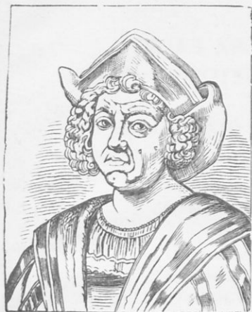
Ὁ Χριστόφορος Κολόμβος

Ἐνας ἄλλος μάλιστα σπουδαῖος ναυτικός, ὁ Χριστόφορος Κολόμβος , ἐσκέφθη πὸς θὰ μπορούσε νὰ πάη πρὸς τὸ σύντομα στὶς