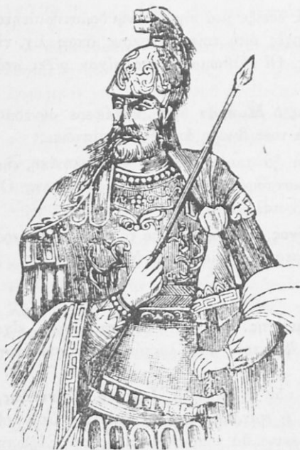
Κωνσταντῖνος ΙΑ' ὁ Παλαιολόγος.

Ὁ Μουράτ ὅμως, πρὶν πεθάνῃ ἀκόμη, ἐκτύπησε τὸν Παλαιολόγο