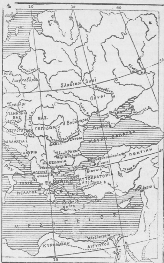
Ἡ Ἑλληνικὴ Αὐτοκρατορία καὶ τὸ Δυτικὸ Κράτος κατὰ τὸν 5ο αἰῶνα.

Ἡ ἀδελφὴ τοῦ Θεοδοσίου ἡ Πουλχερία , που πολὺ ἀγαποῦσε τὴν Ἑλλάδα καὶ τὴν Ἑλληνικὴ παιδεία, ἐμερίμνησε καὶ ἐκτίσθηκε στῆ Πόλι