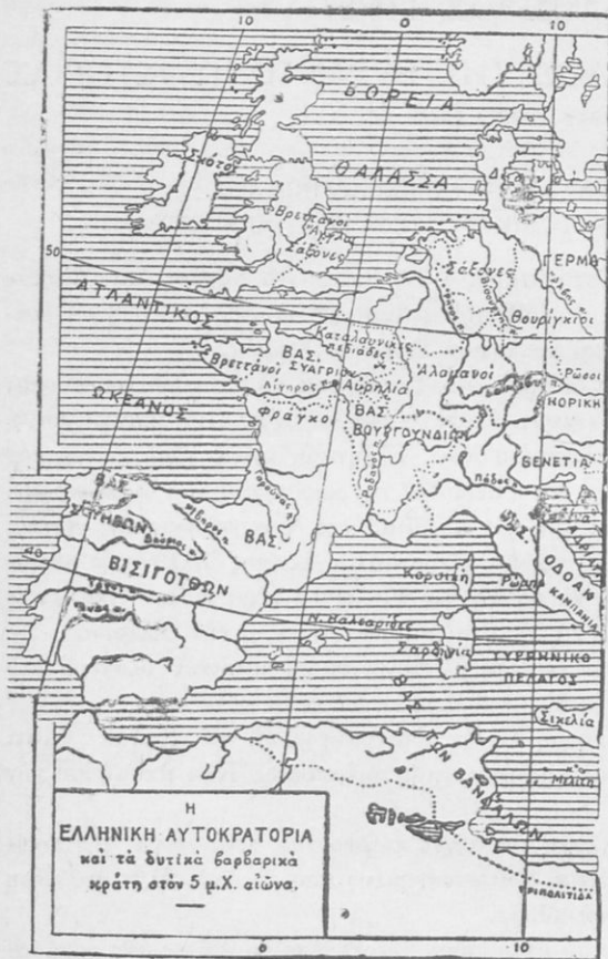
Ἡ Ἑλληνικὴ Αὐτοκρατορία καὶ τὸ Δυτικὸ Κράτος κατὰ τὸν 5 ο αἰῶνα.

Ἐρωτήσεις. — Ποία ἦταν ἡ ἐθνολογικὴ σύσταση τοῦ Ἀνατολικοῦ Ρωμαϊκοῦ Κράτους; 2. Πῶς καὶ γιατί ἦταν ἐπικρατέστερο τὸ Ἑλληνικὸ στοιχεῖο; 3. Πῶς μπόρεσε νὰ ἐπιβληθῇ ὁ Ἑλληνισμὸς στὸ Νέο Κράτος; 4. Μπορεῖτε νὰ ἀναπτύξετε τίς δυνατότητες ποὺ παρουσίαζε τότε ὁ Ἑλληνισμὸς;