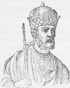
Βασίλειος Β' ὁ Βουλγαροκτόνος

Συγκεντρώνει πολὺ σύντομα στὰ χέρια του ὅλες τὶς ἐξουσίες καὶ ἀποκτᾷ μιὰ τεράστια δύναμι, πὸν τὸν ἔκαμε ὥστε νὰ μὴν τοῦ χρειάζεται ἡ διπλωματικότης. Ἦταν ἀπότομος καὶ μονοκόμματα ἴσιος. Ἐνας ἀπλὸς χωρικός στὸ φέρσιμο, ὁ γενναῖος Βασίλειος, πὸν μέσα στὸ κοντὸ σῶμα του φώλιαζε μιὰ σιδερένια θέλησις.