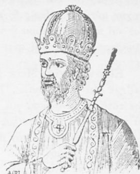
Λέων Γ' ὁ Ἰσαυρος.

Ἐπειὰ ἀπ' αὐτὰ, οἱ Ἄραβες δὲν ξαναενοχλοῦν σημαντικὰ τὸ Βυζάντιο.