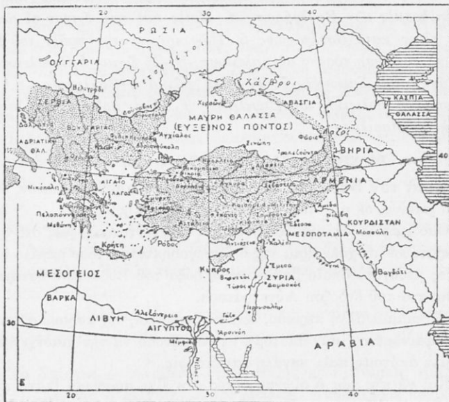
Ἡ Αὐτοκρατορία στὰ χρόνια τοῦ Βουλγαροκτόνου.

Μετὰ ἀπὸ ὅλα αὐτὰ, ἐφρόντισε καὶ γιὰ τὴν ἐσωτερικὴν ὀργάνωσιν τοῦ Κράτους του. Ἐλαβε διάφορα νομοθετικὰ μέτρα γιὰ νὰ ἀνακου-