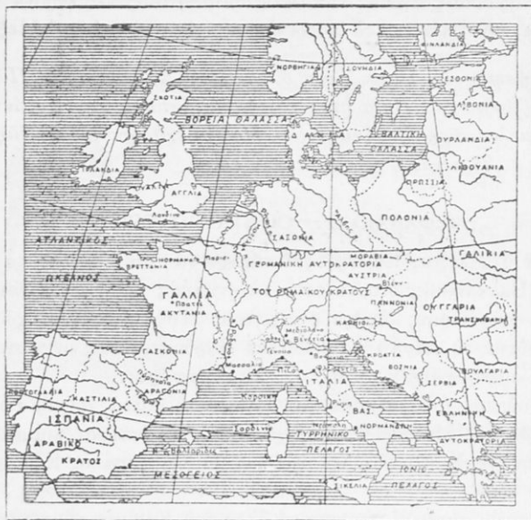
Ἡ Εὐρώπη κατὰ τὰ χρόνια τῶν Σταυροφοριῶν.

Πολλοί ὑπῆρξαν οἱ δημιουργοὶ αὐτοῦ τοῦ ξεσηκώματος τῆς Χριστιανοσύνης. Ἐνας ἀπ' αὐτούς, ὁ Πέτρος ὁ Ἐρημίτης. Ἦταν ἓνας καλόγηρος ποὺ ἤλθε νὰ προσκυνήσῃ στὰ Ἱεροσόλυμα καί, ἀφοῦ ὑπέ-