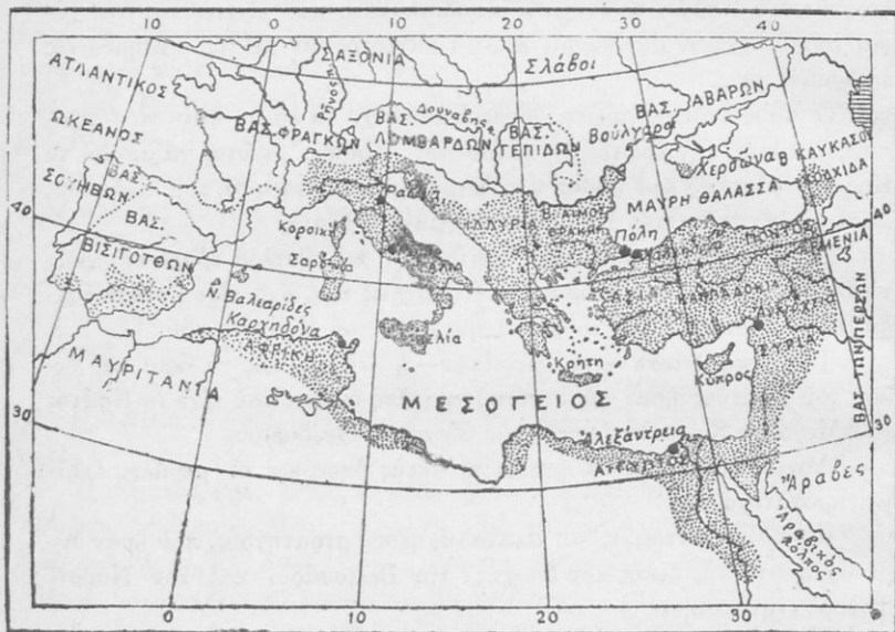
Ἡ Βυζαντινὴ Αὐτοκρατορία στὰ χρόνια τοῦ Ἰουστινιανοῦ.

Προχωρεῖ καὶ κατακτᾷ ὅλη τὴν παλιὰ Ρωμαϊκὴν Ἀφρική. Διαλύει τὸ Κράτος τῶν Βανδάλων, συλλαμβάνει αἰχμάλωτο τὸν Γελίμερο καὶ τὸν φέρνει στὰ 533 στὴν Κωνσταντινούπολι. Ὁ θρίαμβὸς του στὸν