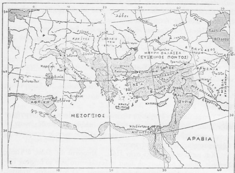
Ἡ Αὐτοκρατορία, στὰ χρόνια τοῦ Ἡρακλείου.

Ἔπειτα, ἐφρόντισε γιὰ τοὺς στρατιῶτες του. Πειθαρχικὰ καὶ ἀφω-