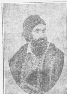
Γρηγόριος Δικαῖος ἢ Παπαφλέσσας

Πολλοὶ πρόκριτοι ἦσαν διστακτικοὶ νὰ πιστεύσουν τὰς διαδόσεις τοῦ Παπαφλέσσα. Ὁ λαὸς ὅμως ἐνθουσιάζετο ἀπὸ τοιούτου εἴδους διηγήσεις. Εἶχε γίνῃ «ὁ μπουρλοτιέρης τῶν ψυχῶν», ὅπως τὸν ἀποκαλεῖ ὁ Σπύρος Μελάς εἰς τὸ ἔργον, τὸ ὁποῖον ἔγραψε διὰ τὸν Παπαφλέσσαν καὶ ὄλοι ἀνέμενον μὲ ἀνυπομονήσαν τὴν μεγάλην στιγμὴν.