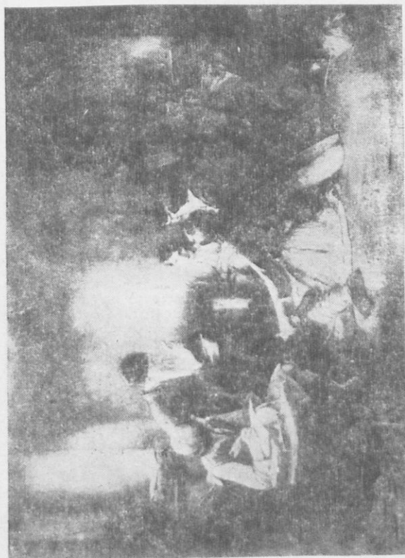
Τὸ κρυφὸ σχολεῖο

Οἱ ναοὶ τῶν μοναστηρίων καὶ οἱ νάρθηκες τῶν ἐκκλησιῶν εἶχον μετατραπῆ εἰς σχολεῖα. Εἰς κάποιαν γωνίαν ὁ