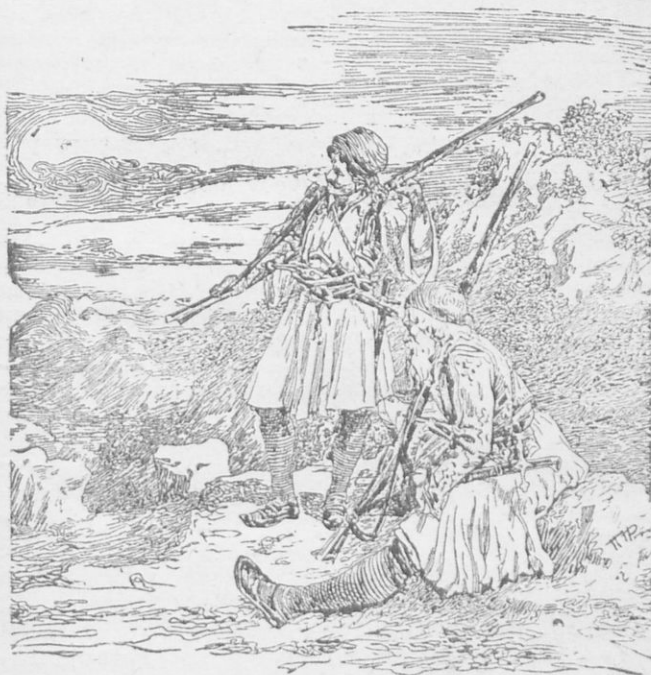
Ἄρματολοι καὶ Κλέφτες

Ἄλλὰ τὰ δεινοπαθήματα, αἱ καταπιέσεις καὶ οἱ ἐξευτελισμοὶ τῶν Ἑλλήνων συνεχίζοντο καὶ ἔγιναν ἡ αἰτία νὰ