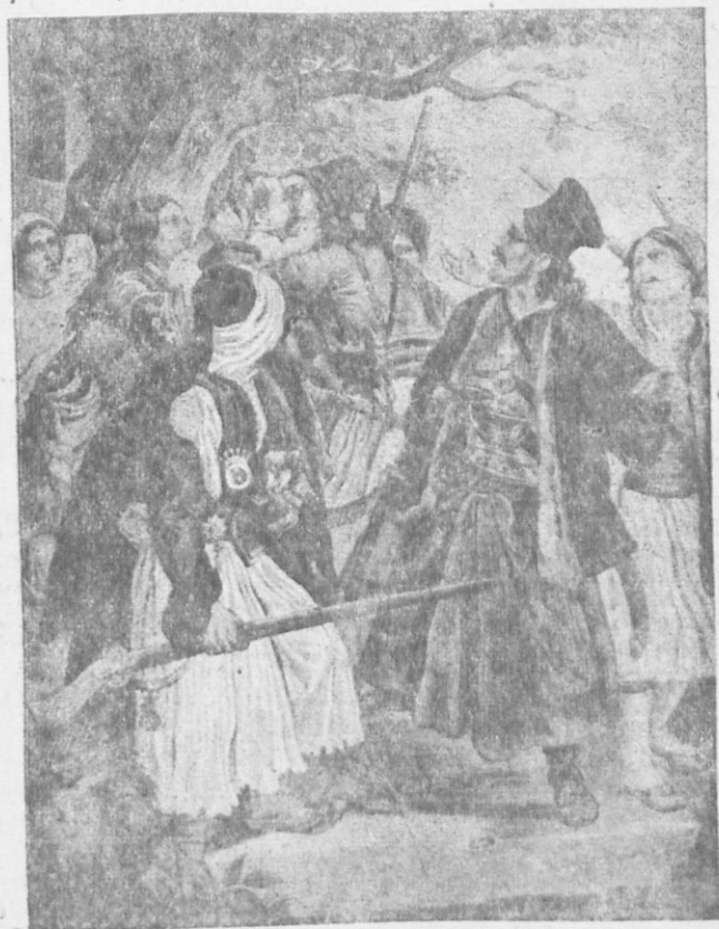
Ὁ Ἀθανάσιος Διάκος

Ἐξηγήθη τότε ἔμπροσθεν τοῦ Ὁμέρ Βρυώνη. Οὗτος ἐθαύμασε τὸ ὄρατιο τοῦ παράστημα καὶ τοῦ προσφέρει μεγάλας τιμὰς καὶ ἀξιώματα, ἂν ἀλλαξοπιστήσῃ. Ὁ Διά-