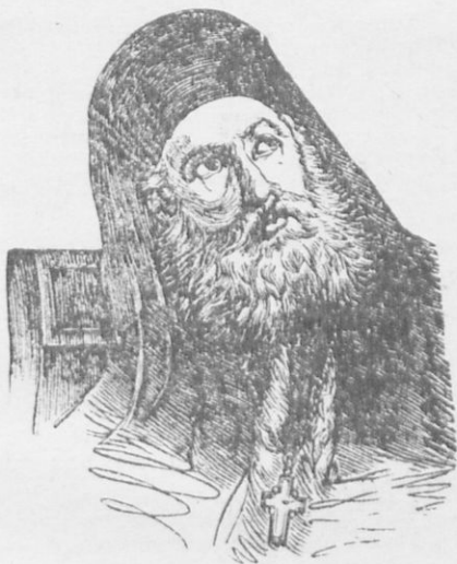
Ὁ Πατριάρχης Γρηγόριος ὁ Ε΄.

Κατὰ τὸ ἀπόγευμα τῆς ἰδίας ἡμέρας οἱ Γοῦρκοι τὸν παρέλαβον ἀπὸ τὴν φυλακὴν, τὸν ὠδήγησαν εἰς τὰ Πατριαρχεῖα καὶ τὸν ἐκρέμασαν ἀπὸ τὴν μεσαίαν πύλην, ὅπου