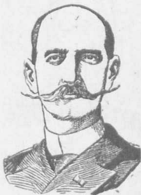
Ὁ Βασιλεὺς Γεώργιος Α'.

Ἐπειτα ἀπὸ τὰς νίκας τῶν συμμάχων ἡ Τουρκίας ὑπέγραψε ἀνακωχὴν εἰς τὴν Καλλιπόλιν καὶ ἔπειτα συνθήκην εἰς τὸ Λονδίνον τὴν 17ην Μαΐου 1913.