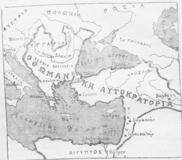
Τὸ Τουρκικὸν Κράτος κατὰ τὴν μεγαλυτέραν του ἀκμὴν.

κούς, Ρώσους και Ένετους εις την Βυζαντινήν Ἱστορίαν ; Εἰς ποίας περιπτώσεις ; 4. Ἀναπτύξατε προφορικῶς ἢ διὰ γραπτῆς ἐργασίας τὸν κίνδυνον, τὸν ὅποιον διέτρεχεν ἡ Εὐ- ρώπη ἀπὸ τοῦς Τούρκους. 5. Ἀνασκόπησις τῆς Ἱστορίας τῶν Τούρκων. (Σελτζούκοι, ὀθωμανοί, σουλτάνοι, ἄγωνες τῶν Τούρκων κτλ.) 6. Ἀρχίσατε νὰ κάμνετε ἔν λεξικόν, εἰς τὸ ὅποιον νὰ γράφετε τὰ ἱστορικά ὀνόματα με συντομον βιο- γραφίαν τῶν. 7. Ἀρχίσατε νὰ κάμνετε λεύκωμα με εἰκόνας ἱστορικῶν προσώπων, μαχῶν, ἱστορικῶν γεγονότων κτλ. 8. Ἐπίσης ἀρχίσατε πίνακα χρονολογιῶν τῶν σπουδαιοτέρων γεγονότων.