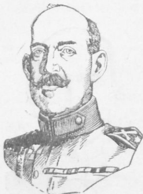
Ὁ Βασιλεὺς Κωνσταντῖνος Β'.

Ἡ Βουλγαρία προέβαλεν μεγάλας ἀξιώσεις καὶ ἰδίως ἐπὶ τῶν ἐδαφῶν, τὰ ὁποῖα κατέλαβον οἱ Ἕλληνες καὶ οἱ Σέρβοι.