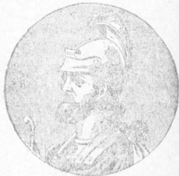
ΛΕΩΝ Ο ΣΟΦΟΣ

2. Αἰὼν ΣΤ', ὁ Σοφός.—Κωνσταντῖνος Δυστυχῶς ὁ διάδοχος τοῦ Βασιλείου Αἰῶν ἕντος Ζ' ὁ πορφυρογέννητος ὁ ΣΤ', ἦτο μὲν σοφὸς ἄνθρωπος, ἀλλὰ παρημέλησε τὰ στρατιωτικὰ καὶ τὸ κράτος ἔπεσε ἐπὶ τῆς βυζαντινῆς μεγάλης συμφορᾶς ἀπὸ τοὺς Βουλγάρους, τοὺς Ἄραβας καὶ τοὺς Ρώμους. Ἐπίσης ἀνίκανοι ἦσαν καὶ οἱ κατόπιν αὐτοκράτορες Κωνσταντῖνος Ζ' ὁ πορφυρογέννητος καὶ Ῥωμανὸς ὁ Β'. Ἄλλ' ὅμως τὸ κράτος ἐσώθη καὶ ἐδοξάσθη ἐπὶ τῆς ἐποχῆς τῶν διότι τότε ἀνεφάνησαν μεγάλοι στρατηγοὶ καὶ εἰσήχθη ἕν λαμπρὸν σύστημα—τὸ σύστημα τῆς συμβυζαντινῆς. Αὐτὸ δὲ ἔσωσε τὸ κράτος. Οἱ Βούλγαροι μὲ τὸν