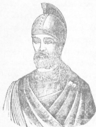
ΜΙΧΑΗΛ Ο ΠΑΛΑΙΟΛΟΓΟΣ

λαιολόγος, ὁ ὁποῖος ἐν τῷ μεταξὺ εἶχε στεφθῆ εἰς τὴν Νίκαιαν μόνος βασιλεὺς, ἀφοῦ παρηγκώνισε τὸν ἀτυχῆ Ἰωάννην Λάσκαριν καὶ ὄλαι αἱ ἐνέργειαι τοῦ εἰς ἐν ἀπέβλεπον—πῶς νὰ γίνῃ κύριος τῆς Κωνσταντινουπόλεως. Πρὸς τὸν σκοπὸν