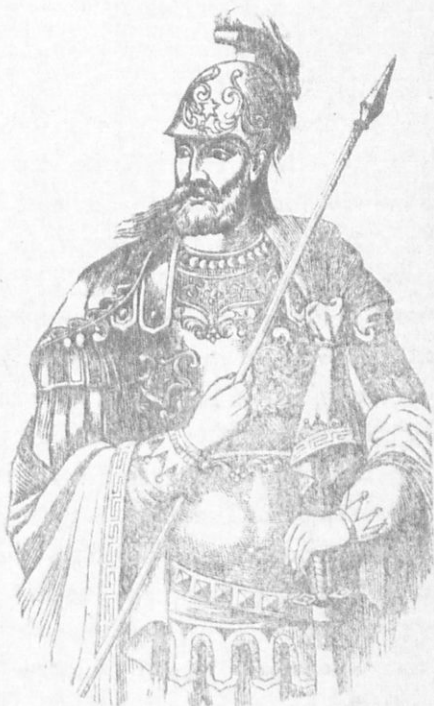
ΚΩΝΣΤΑΝΤΙΝΟΣ ΙΑ' Ο ΠΑΛΑΙΟΛΟΓΟΣ

κατείχον οι Ένετοι και ὀλίγοι Ἕλληνες δεσπότες· εὐρίσκειτο δὲ πρὸς τούτοις τὸ κράτος εἰς μεγάλην παρακμὴν καὶ ἀθλιότητα. Ἡ Κωνσταντινούπολις, ἡ ὁποία ἄλλοτε εἶχε πληθυσμὸν 500 χιλ. κατοίκους, τώρα εἶχε μόλις 80,000· αἱ δὲ πρόσοδοι τοῦ βίου κράτους δὲν ὑπερέβαινον τὰ 3 ἑκατομ-