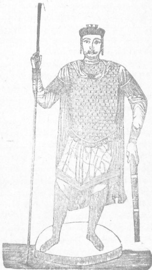
ΒΑΣΙΛΕΙΟΣ Β΄ Ο ΒΟΥΛΓΑΡΟΚΤΟΝΟΣ

1. Ἐπιδρομαὶ τῶν Βουλγάρων Ὅταν ἀπέθανεν ὁ Τσι- ἐπὶ Βασιλείου ἦτα αὐτῶν παρὰ τὸν μισκῆς, ἀνέλαθε τὴν ἀρ- Σπερχειόν. χὴν ὁ νόμιμος διάδοχος τοῦ θρόνου Βασίλειος ὁ Β΄, ὁ ὁποῖος ἦτο μόλις εἴκοσι ἐτῶν.