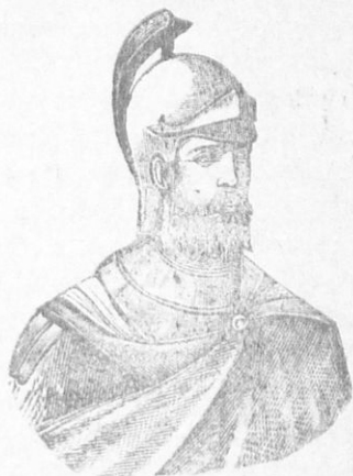
ΑΝΔΡΟΝΙΚΟΣ Ο Β΄.

τὴν εἰρήνην εἰς τὴν ἐκκλησίαν, διότι ἀκώρωσε τὴν περὶ ἐνώ- σεως τῶν ἐκκλησιῶν πράξιν τοῦ πατρὸς του· ἔπειτα δέ, ἵνα ἀποκρούσῃ τοὺς ἐν Ἀσίᾳ ἐμφανισθέντας νέους ἐπικινδύνους ἐχθροὺς, τοὺς Ὀθωμανοὺς Τούρ- κους, ἐπροσκάλεσεν ἐκ τῆς Ἰσπα- νίας τυχροδίκτας μισθοφόρους τοὺς ὀνομαζομένους Καταλονοὺς ὕπὸ τὸν τολμηρὸν ἀρχηγόν Δε- φλὸρ, ἀντὶ νὰ ἀντιτάξῃ ἐγγώ- ριον στρατόν, ὃ ὁποῖος δὲν θὰ ἀ- παιτοῦσε καὶ μεγάλην δαπάνην. Οὕτω ἐνῶ κατ' ἀρχὰς ὑπερή- σπισαν γενναίως τὰς ἐν Μικρᾷ Ἀσίᾳ Ἑλληνικὰς ἰσχύρας, ἀπέ- βησαν ταχέως ἢ μάλιστα τῶν