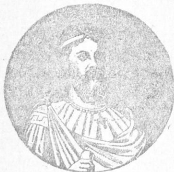
ΒΑΣΙΛΕΙΟΣ Ο ΜΑΚΕΔΩΝ

σνιοι καὶ οἱ Σέρβοι ἀνεγνώρισαν καὶ πάλιν τὴν Ἑλληνικὴν κυριαρχίαν, τὴν ὁποίαν ἐπὶ Ἰραυλοῦ εἶχαν ἀποτινάξει· ὁ δὲ Βασιλεὺς, ἀφοῦ ἔστειλε Ἑλληνας ἱερεῖς διέδωκεν εἰς αὐτοὺς τὸν Χριστιανισμόν. Μὰ τὰς ἐνεργείας τοῦ Βασιλείου ἔγιναν ἐπίσης Χριστιανοὶ καὶ οἱ Ἑλευθερολόκωνες, δηλαδὴ οἱ πρόγονοι τῶν σημερινῶν Μαγιατῶν, οἱ ὁποῖοι μέχρι τῆς ἐποχῆς ἐκείνης ἦσαν εἰδωλολάτραι. Τότε καὶ οἱ Βούλγαροι, εἰς τοὺς ὁποίους εἶχεν