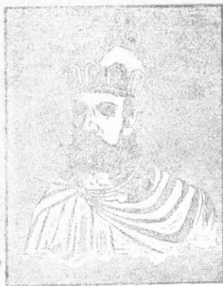
ΘΕΟΔΟΣΙΟΣ Ο ΜΕΓΑΣ

ἀγαλμάτων τῆς ἀρχαίας θρησκείας, ἀποστάτησε ἀπὸ τὸν Χριστιανισμόν καὶ ἠσπάσθη τὴν εἰδωλολατρείαν, δι' αὐτὸ