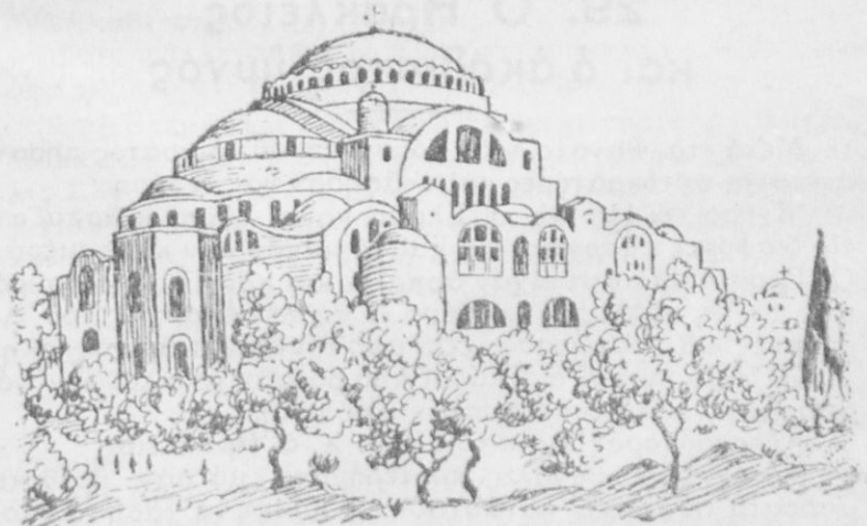
Ὁ ναὸς τῆς Ἁγίας Σοφίας στὰ χρόνια τοῦ Ἰουστινιανοῦ

Ὁ Ἀνθέμιος καὶ ὁ Ἰσιδώρος ἔκαμαν τὸ σχέδιον καὶ πῆραν 10000 ἑργάτες καὶ ἐργάζονταν.