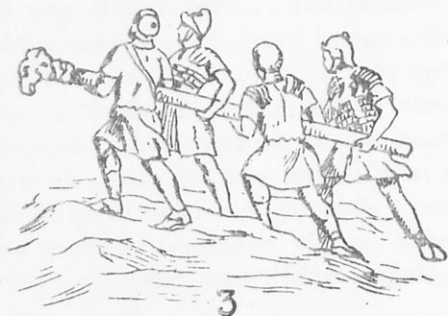
3. Κριδς φορητὸς (πρὸς παραβίασιν κυρίως πυλῶν)