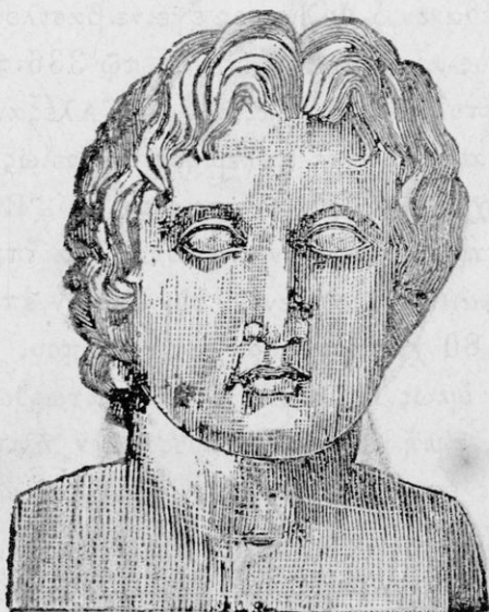
Ο ΜΕΓΑΣ ΑΛΕΞΑΝΔΡΟΣ.

Οἱ Ἕλληνες μαθόντες τὸν θάνατον τοῦ Φιλίππου ἐπανεστάτησαν καὶ μάλιστα οἱ Θηβαῖοι, κατὰ τοῦ υἱοῦ του Ἀλεξάνδρου, νομίσαντες ὅτι ἠδύνατο νὰ καταβάλῃσι τὸ παιδίον ἐκεῖνο. Ὁ Ἀλέξανδρος τότε ἐλθὼν εἰς τὴν Ἑλλάδα ἐτιμώρησεν αὐστηρῶς τοὺς ἐπαναστάτας, καὶ