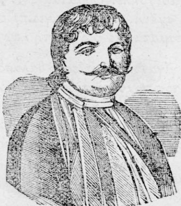
Ο ΡΗΓΑΣ ΦΕΡΑΙΟΣ.

καλός του ἔλεγεν, ὅτι ἐξ ἅπαντος ὁ Ῥήγας θὰ γείνη μέγας καὶ ἔθνωφελὴς ἀνὴρ, ὅλοι δὲ οἱ συμμαθηταὶ του ἠγάπων καὶ ἐσέβοντο αὐτόν.