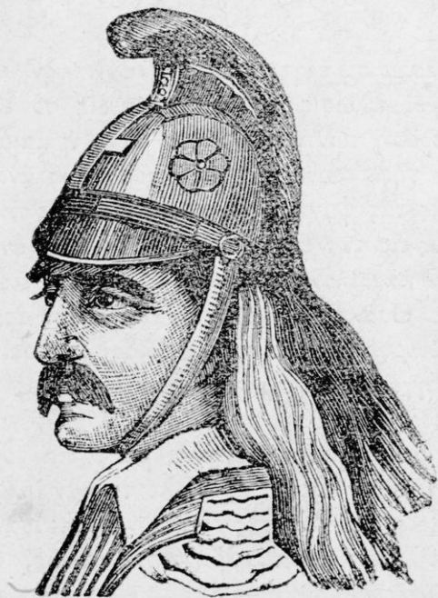
13. Ο ΓΕΡΟ ΚΟΛΟΚΟΤΡΩΝΗΣ.

Ἀπὸ τοὺς πρώτους καὶ ἐνδοξοτάτους ἥρωας τῆς μεγάλης