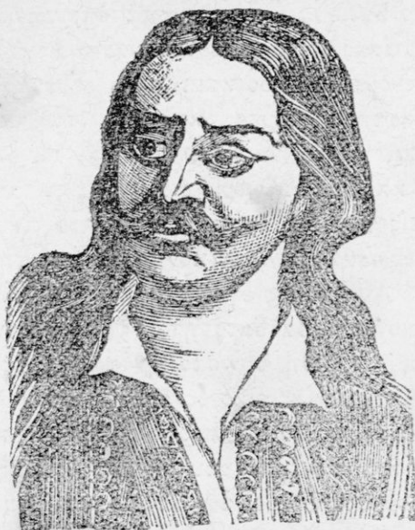
Ο ΑΘΑΝΑΣΙΟΣ ΔΙΑΚΟΣ

Μέγαν ἄνδρα ἐγέννησεν ἡ Μουσουνίτσα, τὸν Ἀθανάσιον Διάκον.