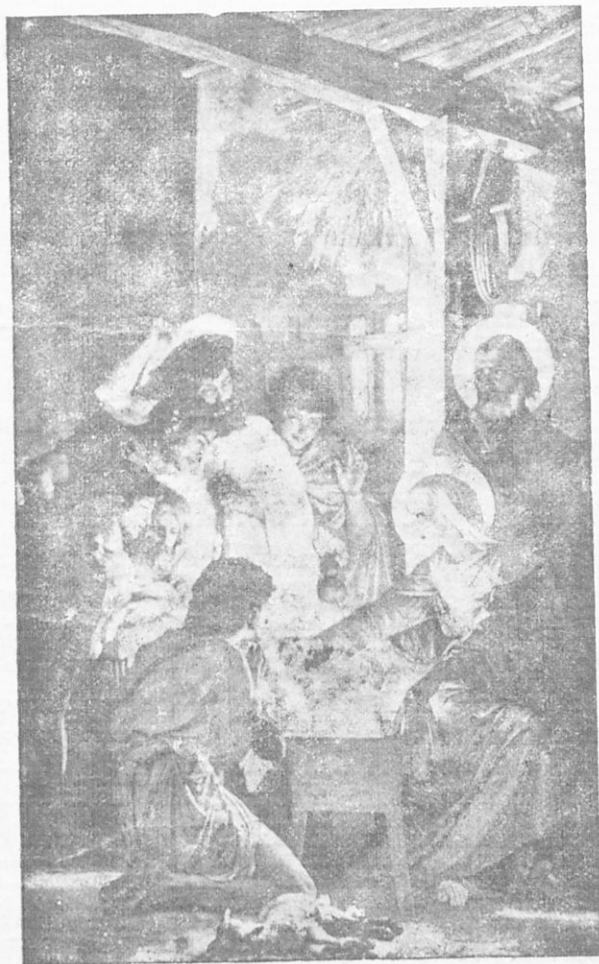
Ἡ γέννησις τοῦ Ἰησοῦ Χριστοῦ.

αὐτοῦς ὁ ἄγγελος· «Μὴ φοβεῖσθε εὐαγγελίζομαι εἰς ὑμᾶς