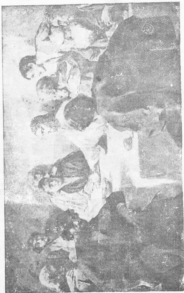
Ὁ μοστιζὸς δαίμων.

δὲν μὲ ἀφήσης νὰ πλύνω τοὺς πόδας σου, δὲν θὰ ἔχῃς μέρος