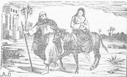
Ὁ Ἰωσήφ φεύγει μετὰ τῆς Μαρίας καὶ τοῦ Ἰησοῦ εἰς Αἴγυπτον.

Ρητόν· «Φυλάσσει Κύριος πάντας τοὺς ἀγαπῶντας αὐτὸν καὶ πάντας τοὺς ἁμαρτωλοὺς ἐξολοθρεύσει». (Ψαλμ. 144, 20).