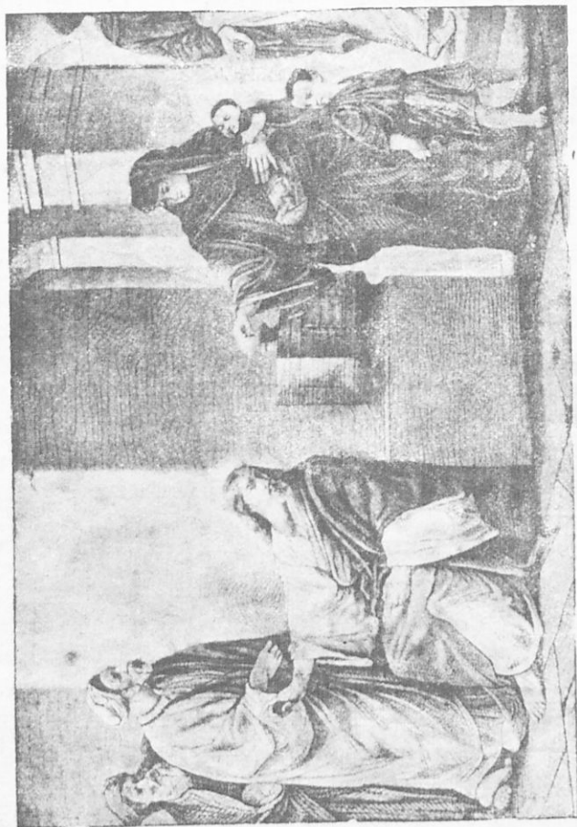
Ὁ ὀβολὸς τῆς χήρας

Καθήμενος δὲ ἐ Ἰησοῦς παρὰ τὸ ταμεῖον τοῦ ναοῦ ἔδλεπε, πῶς οἱ ἄνθρωποι προσήρχοντο καὶ ἔρριπτον εἰς αὐτὸ χρή-