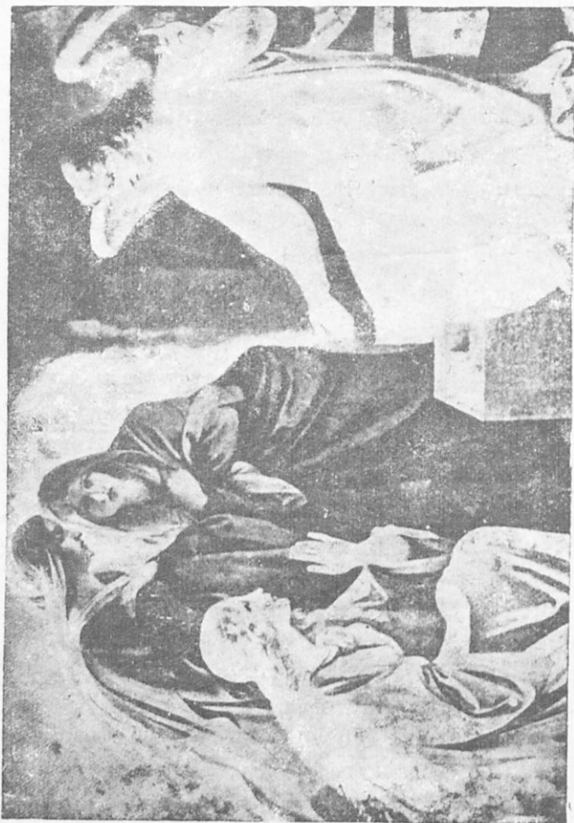
Ἡ ἀνάστασις τοῦ Ἰησοῦ.

γυναῖκες εἰσελθοῦσαι εἰς τὸ μνήμα εἶδον ὄρατον νεανίσκον, ἐνδεδυμένον στολὴν λαμπράν, ὃ ὅποιος ἐκάθητο ἐκ δεξιῶν