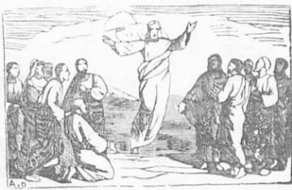
Ἡ ἀνάληψις τοῦ Ἰησοῦ.

Τὴν τεσσαρακοστὴν ἡμέραν ἀπὸ τῆς ἀναστάσεως αὐτοῦ, ὠδήγησεν ὁ Ἰησοῦς τοὺς μαθητὰς αὐτοῦ εἰς τὴν Βηθανίαν καὶ εἶπεν εἰς αὐτοὺς τὴν ἐξῆς παραγγελίαν· «Μὴ ἀπομακρυνθῆτε τῆς Ἱερουσαλήμ, ἀλλὰ περιμείνατε ἐκεῖ ἕως οὗ ἐκπληρωθῶσι πάντα, ὅσα ὑπεσχέθη ὁ Πατήρ καὶ ὅσα ἠκούσατε παρ' ἐμοῦ· ὁ μὲν Ἰωάννης ἐβάπτισε με ὕδωρ, ὑμεῖς δὲ θὰ βαπτισθῆτε με πνεῦμα Ἅγιον ἐντὸς ὀλίγων ἡμερῶν· θὰ λάβητε δὲ τὴν δύναμιν τοῦ Ἁγίου Πνεύματος, τὸ ὅποῖον θὰ ἔλθῃ εἰς ὑμᾶς καὶ θὰ μοι γεί-