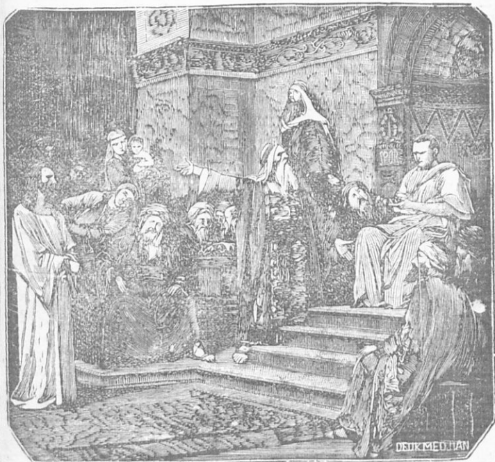
Ὁ Ἰησοῦς ἐνώπιον τοῦ Πιλάτου.

Τὴν πρωΐαν τῆς Παρασκευῆς συμβούλιον ἔλαβον πάντες οἱ ἀρχιερεῖς καὶ οἱ πρεσβύτεροι κατὰ τοῦ Ἰησοῦ ἵνα θανατώσωσιν αὐτόν. Παραλαβόντες δὲ τὸν Ἰησοῦν ὠδήγησαν αὐτόν εἰς τὸν Πόντιον Πιλάτον, τὸν ἡγεμόνα, διότι οὗτος