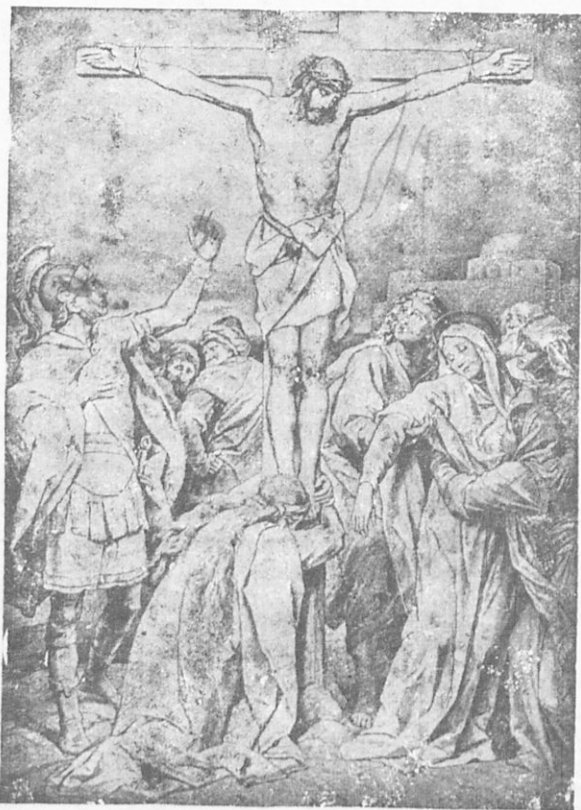
Σταύρωσις τοῦ Ἰησοῦ.

σεαυτὸν καὶ ἡμᾶς». Ἄλλ' ὁ ἄλλος ἐπέπληττεν αὐτὸν λέγων· «Δὲν φοβεῖσαι τὸν Θεὸν λέγων ταῦτα; Καὶ ἡμεῖς μὲν δικαίως πάσχομεν, διότι ἀπολαμβάνομεν ἄξια τῶν ἔσων