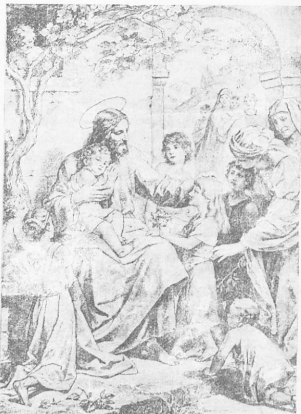
Ὁ Ἰησοῦς εὐλογεῖ τὰ παιδιά.

Ὅτε ἔφθασαν εἰς Καπερναοὺμ προσήλθον εἰς τὸν Ἰησοῦν οἱ μαθηταὶ αὐτοῦ καὶ ἠρώτησαν αὐτόν· «Τίς ἐξ αὐτῶν θέλει ἔλθαι μετ' ἐμοῦ ἵνα βασιλεύσῃ μετ' ἐμοῦ ἐν τῇ βασιλείᾳ τῶν οὐρανῶν;» Τότε δὲ Ἰησοῦς προσκαλέσας ἑνὸν παιδίον ἔδειξεν αὐτὸ εἰς τοὺς μαθη-