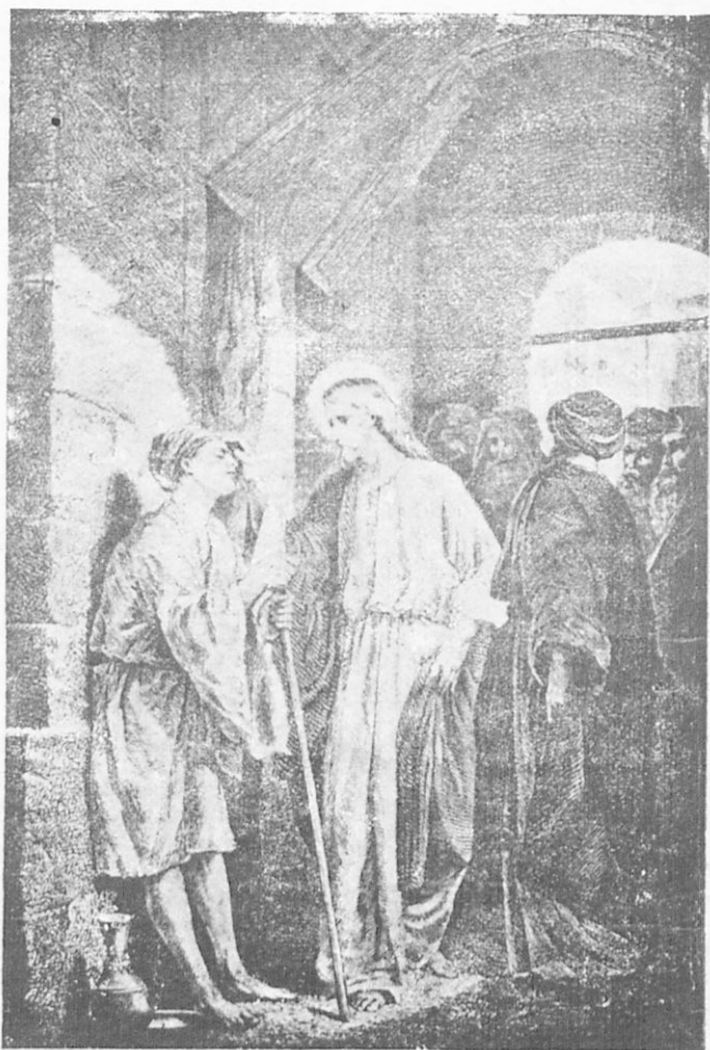
Ὁ Ἰησοῦς θεραπεύει τὸν ἐκ γενετῆς τυφλόν.

ἄλλοι δὲ μὴ πιστεύοντες ἔλεγον εἰς τὸν ἀναβλέψαντα, ὅτι