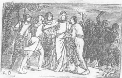
Ἡ σύλληψις τοῦ Ἰησοῦ.

αὐτοὺς ἐκ δευτέρου· «Τίνα ζητεῖτε;» Ἐκεῖνοι δ' ἀπεκρίθησαν· «Ἰησοῦν τὸν Ναζωραῖον». Τότε λέγει εἰς αὐτοὺς ὁ Ἰησοῦς· «Σὰς εἶπον, ἐγὼ εἰμι. Ζητήσατε ἐμὲ καὶ ἄφετε τοὺς ἄλλους ν' ἀπέλθωσιν». Ἐπειδὴ δὲ ὁ προδότης Ἰούδας εἶχε προείπη εἰς αὐτοὺς νὰ συλλάβωσιν ἐκεῖνον, τὸν ἔποισον αὐτὸς θὰ ἐφίλει, ἐπλησίασε τότε τὸν Ἰησοῦν καὶ εἶπε πρὸς αὐτόν· «Χαῖρε, Ραββί» καὶ ἐφίλησεν αὐτόν. Ὁ δὲ Ἰησοῦς εἶπε πρὸς αὐτόν· «Μὲ φίλημα λοιπόν, Ἰούδα, παραδίδεις τὸν υἱὸν τοῦ ἀνθρώπου;»