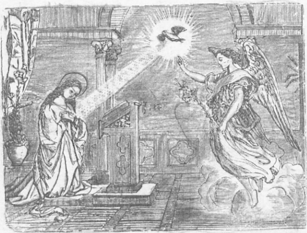
Χαῖρε κεχαριστομένη Μαρία.

Μετὰ ἕξ μῆνας ἀπέστειλεν ὁ Θεὸς τὸν αὐτὸν ἀγγελοῦ Γαβριὴλ εἰς Ναζαρέτ, πόλιν μικρὰν τῆς Γαλιλαίας, πρὸς τὴν Παρθένον Μαρίαν. Ἦτο δὲ ἡ Παρθένος Μαρία κόρη ἐνάρετος