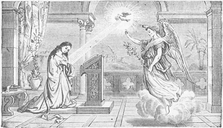
Ὁ Εὐαγγελισμὸς τῆς Θεοτόκου.

Ὁ εὐαγγελισμὸς τῆς Θεοτόκου. Τὸν ἔκτον μῆνα ἀπὸ τῆς συλλή-