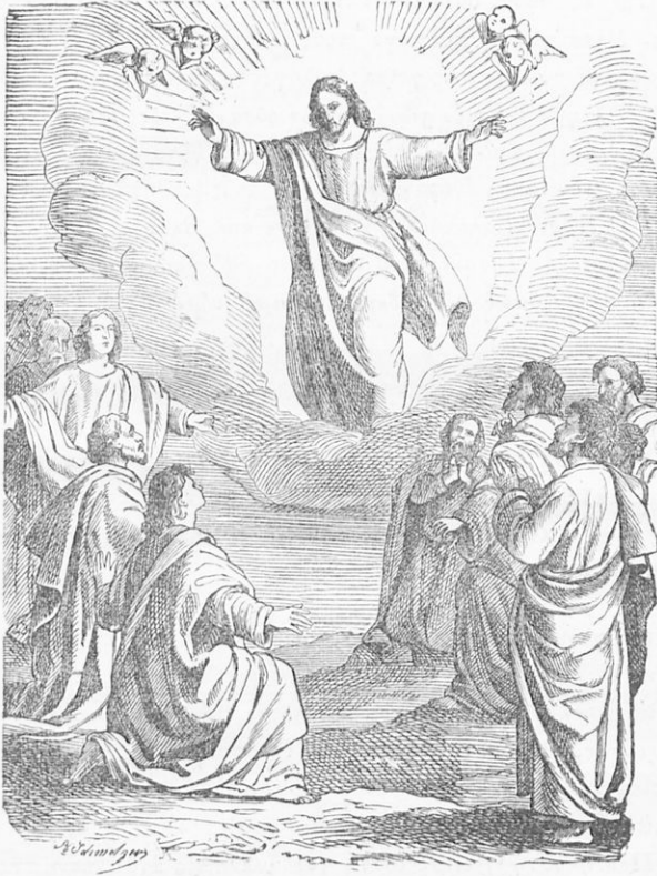
Ἡ ἀνάληψις τοῦ Σωτῆρος.

Ἡ ἑορτὴ τῆς Ἀναλήψεως ἐορτάζεται τὴν τεσσαρακοστὴν ἀπὸ τῆς ἀναστάσεως ἡμέραν, κατὰ τὴν ὁποίαν ὁ Κύριος ἀνελήφθη εἰς τοὺς οὐρανοὺς ἀπὸ τοῦ ὄρους τῶν Ἑλαιῶν. Ἐπὶ τεσσαράκοντα ἡμέ-