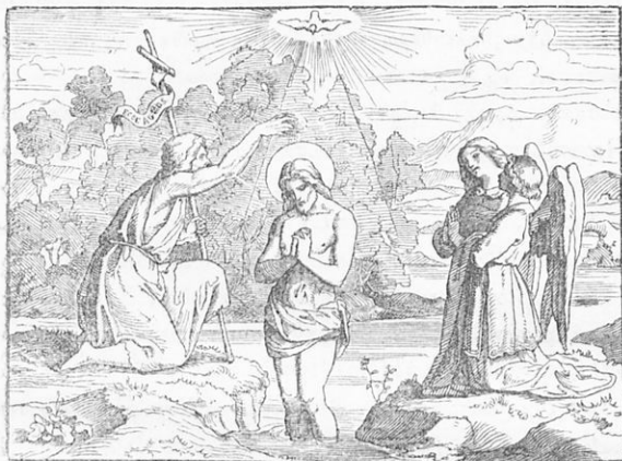
Ἡ βάπτισις τοῦ Χριστοῦ.

Όνομάζεται Θεοφάνεια ή 'Επιφάνεια, διότι κατά την βάπτισιν του Κυρίου έφανερώθη ή θεότης αυτού· ονομάζεται δέ και Φῶτα,