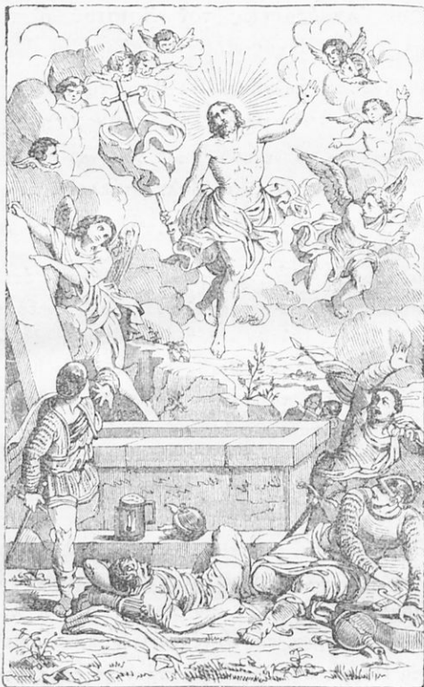
Ἡ ἀνάστασις τοῦ Χριστοῦ.

ἐν ἀρχῇ, ὥρισθη ἐν τέλει εἰς ἑπτὰ ἑβδομάδας, περιλαμβανομένης καὶ τῆς μεγάλης ἑβδομάδος, κατὰ τὴν ὁποίαν ἐτηρεῖτο χύστηρο-τάτη νηστεία. Ἐκλήθη δὲ ἡ πρὸ τοῦ Πάσχα νηστεία μεγάλη τεσσαρακοστή.