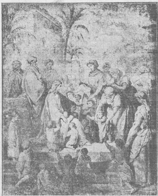
Ὁ Ἰησοῦς εὐλογεῖ τὰ παιδιά

δία γὰ ἐλθωσιν πρὸς ἐμὲ καὶ μὴ τὰ ἐμποδίζεσθαι, διότι τῶν τοιούτων εἶναι ἡ βασιλεία τῶν οὐρανῶν. Ἔπειτα ἔλαβε τὰ παιδιά, τὰ ἐφίλησε