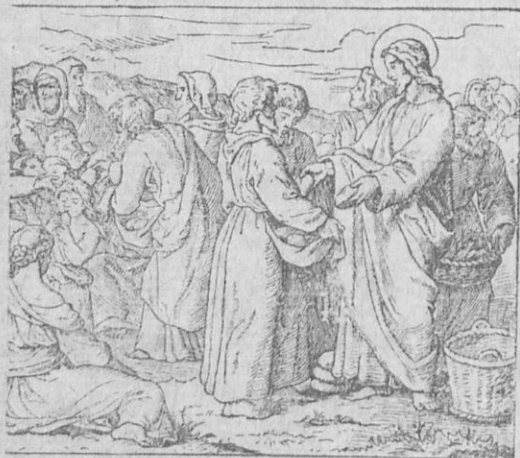
Ὁ χορτασμός τῶν πεντακισχιλίων.

Ἄπόλυσον τὰ πλήθη νὰ ὑπάγωσιν εἰς τὰς οἰκίας των νὰ δειπνήσουν· διότι θὰ πεινῶσιν». Ὁ Ἰησοῦς ἀπεκρίθη «Δώσατε σεῖς εἰς αὐτοὺς νὰ φάγωσιν.» Οἱ δὲ μαθηταὶ εἶπον· «Ἡμεῖς μόνον πέντε ἄρτους καὶ δύο ἰχθῦς ἔχομεν». Τότε λέγει ὁ Ἰησοῦς. «Φέρετέ μοι αὐτά». Οἱ μαθηταὶ τότε ἔφερον πρὸς τὸν Ἰησοῦν τοὺς πέντε ἄρτους καὶ τοὺς δύο ἰχθῦς.