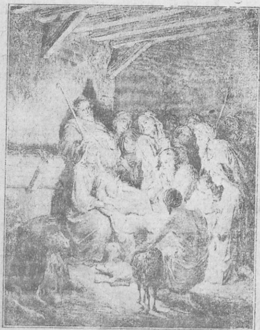
Ἡ γέννησις τοῦ Χριστοῦ.

Ἀλλὰ κατὰ τὴν νύκτα ταύτην ἦλθεν ἡ ὥρα, κατὰ τὴν ὁποίαν ἡ Μαρία ἐμελλε νὰ γεννήσῃ τὸν μικρὸν Ἰησοῦν τὸν υἱὸν τοῦ Θεοῦ. Ἐπειδὴ δὲ δὲν εἶχε φέροι μεθ' ἑαυτῆς οὔτε κλινὴν οὔτε λίκνον, περιετόλιξε τὸ μικρὸν παιδίον εἰς τὰ σπαργανα καὶ τὸ ἔθεσεν εἰς τὴν φάτνην. Καθ' ἣν δὲ στιγμήν ἐγεννήθη τὸ θεῖον βρέφος, φῶς