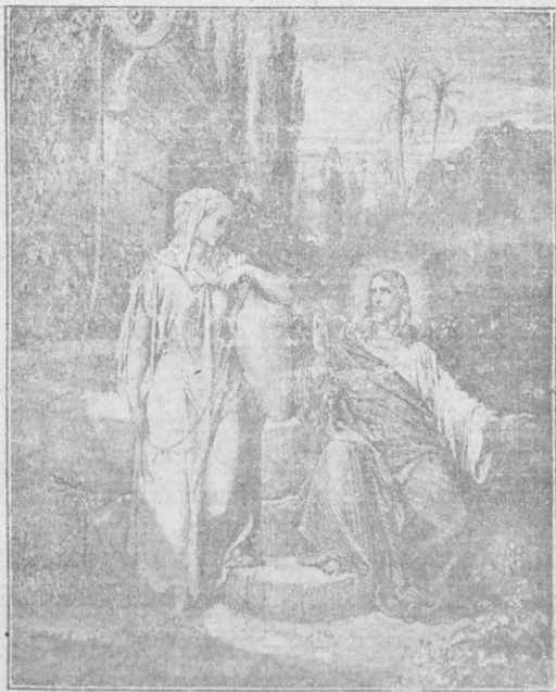
Ὁ Ἰησοῦς καὶ ἡ Σαμαρεῖτις.

«Καλῶς εἶπες ὅτι δὲν ἔχεις ἄνδρα», ἀπήντησεν ὁ Ἰησοῦς· διότι πέντε ἄνδρας εἶχες μέχρι τοῦδε καὶ ἐκεῖνος, μὲ τὸν ὁποῖον