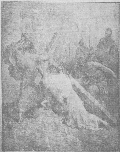
Ὁ Ἰησοῦς φέρει τὸν σταυρόν.

Ἰησοῦς ἀπέκαμε πλέον, καὶ εὗρον τὸν Σίμωνα, τὸν ὁποῖον ἠγγάρευ-