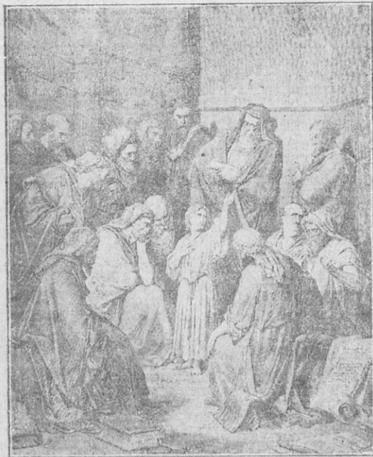
Ὁ Ἰησοῦς δωδεκαετής διδάσκων ἐν τῷ ναῷ.

Ἡ ἑορτὴ τοῦ Πάσχα διήρκει ὀκτὼ ἡμέρας. Μετὰ τὸς ὀκτὼ ἡμέ-