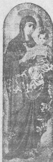
Μήτηρ τῶν Χριστιανῶν.

τοὺς διὰ μιᾶς περὶ τὴν κλίνην τῆς Θεοτόκου, ἐπὶ τῆς ὁποίας ἀνέκειτο προσμένουσα τὴν σιγμὴν τῆς ἐκ τοῦ κόσμου τούτου ἀποδημίας της.