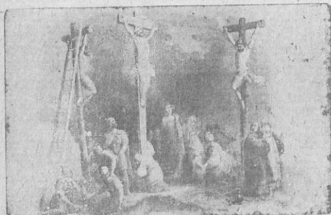
Ἡ σταύρωσις τοῦ Ἰησοῦ.

σαν να φορτωθῆ τὸν σταυρὸν τοῦ Ἰησοῦ. Ἦκολούθει δὲ πλῆθος λαοῦ καὶ γυναῖκες πολλαὶ κλαίουσαι τὸν Ἰησοῦν· στραφεὶς δὲ ὁ Ἰησοῦς λέγει πρὸς αὐτάς. «Μὴ κλαίετε δι' ἐμέ, γυναῖκες, ἀλλὰ κλαίετε διὰ τὸν ἑαυτὸν σας καὶ τὰ τέκνα σας».