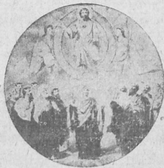
Ἡ ἀνάληψις τοῦ Χριστοῦ.

«Ὅτε πλέον δὲν θὰ εἶμαι μεθ' ὑμῶν», ἔλεγε πρὸς αὐτούς, «ὑπάγετε καὶ διδάξατε πάντα τὰ ἔθνη νὰ πιστεύσωσιν εἰς ἐμὲ καὶ νὰ τηρῶσι τὰς ἐντολάς, τὰς ὁποίας ἔδωκα εἰς ὑμᾶς, καὶ βαπτίζετε αὐτούς. Καὶ ἂν δὲν μὲ βλέπητε ἐν τῷ μέσῳ ὑμῶν, θὰ εἶμαι ὅμως πάντοτε πλησίον σας καὶ θὰ σᾶς δίδω δύναμιν καὶ θάρρος». Τὴν τεσσαράκοστήν ἡμέραν παρέλαβεν ὁ Ἰησοῦς τοὺς μαθητὰς του καὶ ἐξῆλθεν ἔξω τῆς πόλεως ἐπὶ τινος ὄρους. Ἐκεῖ δὲ ὕψωσε τὰς χεῖράς του, ἠλόγησε τοὺς μαθητὰς του καὶ τοὺς ἀπεχαιρέτισεν.