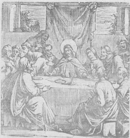
Ὁ δεῖπνος ὁ μυστικός.

Ἦλθον λοιπὸν οἱ μαθηταὶ πρὸς τὸν Ἰησοῦν καὶ τὸν ἠρώτησαν· «Κύριε, ποῦ θέλεις νὰ σοὶ εἰτοιμάσωμεν νὰ φάγῃς τὴν φορὰν ταύτην τὸ Πάσχα ;» Ὁ δὲ Ἰησοῦς εἶπε πρὸς δύο ἐκ τῶν μαθητῶν του· «Υπάγετε εἰς τὴν πόλιν, ἐκεῖ θὰ ἀπαντήσητε ἄνθρωπον κρατοῦντα