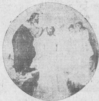
Ἡ βάπτισις τοῦ Χριστοῦ.

Ἡμέραν δὲ τινα ἦλθε καὶ ὁ Ἰησοῦς εἰς τὴν ἔρημον πρὸς τὸν Ἰωάννην καὶ ἤθελε νὰ βαπτισθῇ ὑπ' αὐτοῦ. Ὁ δὲ Ἰωάννης εἶπε πρὸς τὸν Ἰησοῦν· «Ἐγὼ ἔχω χρεῖαν νὰ βαπτισθῶ παρὰ σοῦ καὶ σὺ ἔρχεσαι πρὸς με ;» Ἄλλ' ὁ Ἰησοῦς ἀπεκρίθη· «Ἄφες τώρα νὰ γίνῃ τοιοῦτοτρόπως. Βάπτισόν με σὺ, διότι πρέπει ἐγὼ νὰ ἐκτελέσω πᾶν ὅ,τι εἶναι δίκαιον καὶ νόμιμον». Τότε ὁ Ἰωάννης ἐβάπτισεν αὐτόν. Ἐνῶ δὲ ὁ Ἰησοῦς ἀνέβαιναν ἐκ τοῦ ὕδατος, ὦ ! τοῦ θαύ-