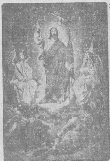
Ἡ ἀνάστασις τοῦ Χριστοῦ.

Τὸ ε' ἄρθρον τοῦ συμβόλου τῆς πίστεως. — Χριστὸς ἀνέστη (ἠγόραστον), τὸ φαῖδρον τῆς ἀναστάσεως κήρυγμα. Ἀναστάσεως ἡμέρα κλπ. Πάσχα ἱερὸν ἡμῖν σήμερον ἀναδέδεικται κλπ.