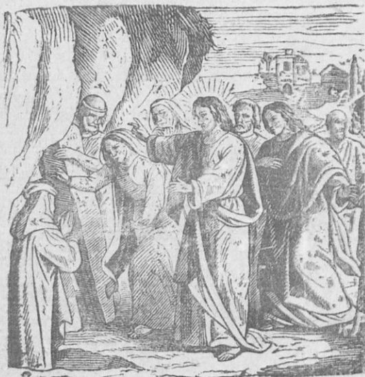
Ἡ ἀνάστασις τοῦ Λαζάρου.

μαθηταί εἶπον· «Κύριε, ἐὰν κοιμᾶται, θά σωθῆ ἐκ τῆς ἀσθενείας», Ἰδὼν δὲ ὁ Ἰησοῦς, ὅτι οἱ μαθηταί του δὲν ἐνόησαν τὸν λόγον του, εἶπε πρὸς αὐτοὺς καθαρῶς. «Ὁ Λάζαρος ἀπέθανεν. ἄς ὑπάγωμεν πρὸς αὐτόν».