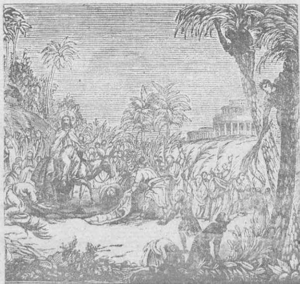
Ἡ θριαμβευτικὴ εἰσοδος τοῦ Ἰησοῦ εἰς Ἱερουσαλήμ.

Οἱ δὲ ἄνθρωποι, ἀφ' οὗ ἤκουσαν ὅτι ὁ Ἰησοῦς ἔρχεται, ἐξῆλθον