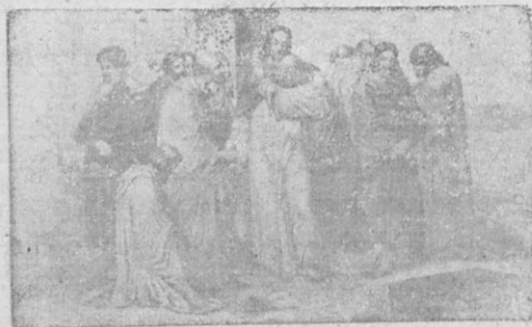
Ἡ προδοσία τοῦ Ἰούδα.

Καθὼς λοιπὸν ἐπλησίασαν πρὸς τὸν Ἰησοῦν, ὁ μαυρὸς Ἰούδας