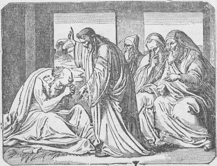
Ἰὼβ καὶ οἱ τρεῖς φίλοι του.

Κατὰ τοὺς χρόνους τοῦ Ἰησοῦ τοῦ Ναυῆ ἔζη εἰς τὴν Αὐσί- τιδα (χώραν πλησίον τῆς Δαμασκού) εὐσεβὴς τις ἄνθρωπος, ὄνο-