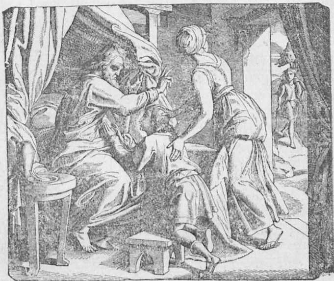
Ὁ Ἰσαὰκ εὐλογεῖ τὸν Ἰακώβ.

ὕποπτευθεὶς ἐκ τῆς φωνῆς, λέγει· Πλησίασε, τέκνον μου, ἵνα σὲ ψηλαφήσω, ἂν τῷ ὄντι οὐ εἶσαι ὁ υἱός μου Ἡσαῦ ἢ ὄχι. Ὁ Ἰακώβ ἐπλησίασεν. Ὁ δὲ Ἰσαὰκ ψηλαφήσας αὐτὸν διστάζει καὶ λέγει· Ἡ μὲν φωνὴ φωνὴ Ἰακώβ, αἱ δὲ χεῖρες χεῖρες Ἡσαῦ. Ἴνα βεβαιωθῇ, ὅτι αὐτὸς εἶναι ὁ Ἡσαῦ, ἐρωτᾷ πάλιν· Σὺ εἶσαι