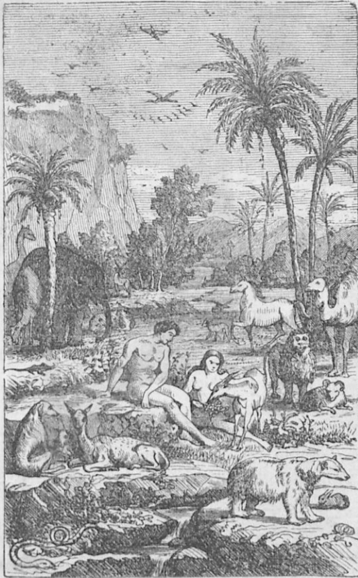
Οἱ πρωτόπλαστοι εἰς τὸν Παράδεισον.

δένδρου τῆς γνώσεως τοῦ καλοῦ καὶ τοῦ κακοῦ καὶ ὅτι, ἂν φά- γωσιν ἀπ' αὐτοῦ, ὄχι μόνον δὲν θὰ ἀποθάνωσιν, ἀλλὰ θὰ εἶναι ὡς ὁ Θεὸς γνωρίζοντες τὸ καλὸν καὶ τὸ κακόν. Οἱ σατανικοὶ οὔτοι λόγοι πείθουσι τὴν γυναῖκα νὰ φάγη ἀπὸ τοῦ ἀπηγορευ-