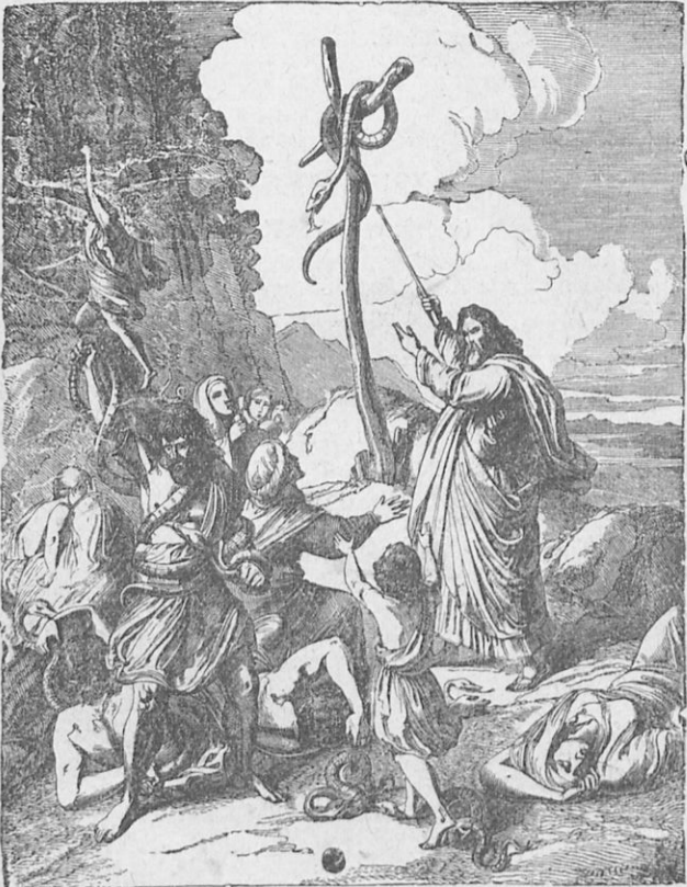
Ὁ χαλκοῦς ὄφεις.

Μετὰ τὴν παρέλευσιν τῶν τεσσαράκοντα ἐτῶν, κατὰ τὰ ὁποῖα