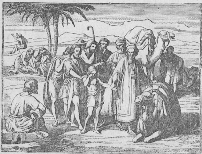
Οἱ ἀδελφοί τοῦ Ἰωσήφ πωλοῦν αὐτὸν εἰς τοὺς Ἰσμαηλίτας.

τότε μόλις ἑνὸς ἔτους). Διὰ τοῦτο δὲ κατεσκεύασεν εἰς αὐτὸν πολυτέλεστατον ἑπανωφόριον. Διὰ τὴν προτίμησιν ὅμως ταύτην ἐμίσησαν τὸν Ἰωσήφ οἱ ἀδελφοί του. Τὸ μῖσος δὲ τοῦτο ἠΰξησεν, ὅτε ὁ Ἰωσήφ διηγῆθη εἰς αὐτοὺς τὰ ἐξῆς δύο ὄνειρα· πρῶτον, ὅτι ἔδεναν δεμάτια εἰς τὴν πεδιάδα καὶ ὅτι τὸ μὲν ἰδικόν του δεμάτιον ἴστατο ὄρθιον, τὰ δὲ δεμάτια τῶν ἀδελφῶν του προσεκύνουν τὸ ἰδικόν του· δεύτερον, ὅτι ὁ ἥλιος (ὁ πατήρ) καὶ ἡ σελήνη (ἡ μήτηρ) καὶ ἑνδεκα ἀστέρες (οἱ ἑνδεκα ἀδελφοί) προ-