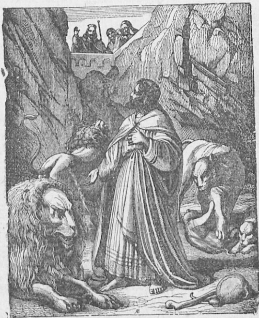
Ὁ Δανιήλ εἰς τὸν λάκκον τῶν λεόντων.

Ἡμέραν τινὰ ὁ βασιλεὺς τῶν Βαβυλωνίων Βαλτάσαρ παρέ-