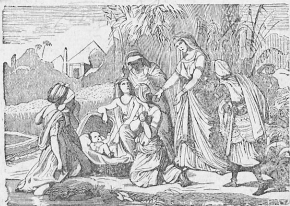
Ὁ Μωυσῆς εἰς τὸν Νεῖλον.

θέτησε πλησίον τῆς ὄχθης τοῦ Νείλου ἐκεῖ, ὅπου συνείθιζε νὰ λούηται ἡ θυγάτηρ τοῦ Φαραῶ· ἐτοποθέτησε δὲ μακρὰν τὴν ἀδελφὴν τοῦ παιδίου Μαριάμ, ἵνα ἴδῃ τί ἔμελλε νὰ συμβῇ. Μετ' ὀλίγον ἦλθεν ἡ βασιλόπαις, ἵνα λουσθῇ. Εἶδε τὸ κιβώτιον, ἔλαβεν αὐτὸ καί, ἀφοῦ τὸ ἠνοιξε, παρετήρησεν, ὅτι ἐντὸς εὐρίσκατο παιδίον, τὸ ὁποῖον ἤρχισε νὰ κλαίῃ. Εὐσπλαγγίσθη αὐτὸ καὶ