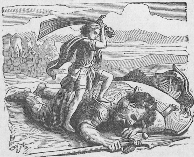
Ὁ Δαυὶδ φονεύει τὸν Γολιάθ.

δι' ὅσα κακὰ ὑπέφερε παρὰ τοῦ Σαούλ, ἀλλὰ καὶ πολλάκις ἔσω- σεν αὐτὸν μὲ κίνδυνον τῆς ἰδίας του ζωῆς καὶ αὐτὸν ἀκόμη τὸν βασιλικὸν θρόνον προθύμως παρεχώρησεν εἰς αὐτόν. Ὅτε δὲ ἀνε- χώρησεν ὁ Δαυὶδ εἰς τὰ ὄρη, ἔπεσεν εἰς τὸν τρόχηλόν του, τὸν κατεφίλησε κλαίων καὶ εἶπε τὰ ἑξῆς. Πορεύου εἰς εἰρήνην· ὁ δὲ δεσμὸς τῆς φιλίας, τὸν ὁποῖον συνήψαμεν ὀρκισθέντες εἰς τὸ ὄνομα τοῦ Κυρίου, ἅς εἶνε ἀδιάσπαστος εἰς αἰῶνα τὸν ἅπαντα.