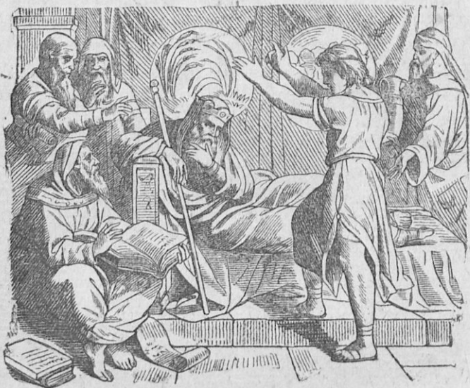
Ἡ Ἰωσήφ ἐξηγεῖ τὰ ὄνειρα τοῦ Φαραὼ.

μαίνουσιν ἑπτὰ ἔτη εὐφορίας, αἱ δὲ ἑπτὰ ἰσχναὶ ἀγελάδες καὶ οἱ ἑπτὰ λεπτοὶ στάχυες σημαίνουσιν ἑπτὰ ἔτη ἀφορίας καὶ πείνης. Ἡ ἐπανάληψις δὲ τοῦ ὄνειρου σημαίνει, ὅτι ὁ Θεὸς ἀπεφάσισε νὰ ἐκτελέσῃ ταῦτα ταχέως. Συνεβούλευσε δὲ τὸν Φαραὼ νὰ εὕρῃ ἄνδρα φρόνιμον, ἵνα συνανθοίσῃ τὸ περίσσευμα τῶν ἐτῶν τῆς εὐφορίας καὶ χρησιμοποίησῃ αὐτὸ κατὰ τὰ ἔτη τῆς ἀφορίας. Ἡ