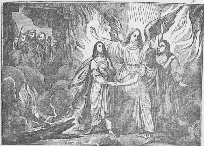
Οἱ τρεῖς παῖδες εἰς τὴν κάμινον.

καὶ ἐκ τῆς καιομένης καμίνου καὶ ἐκ τῶν χειρῶν σου, ἀλλά, ἐὰν δὲν μᾶς σώσῃ, γινώριζε, ὅτι οὔτε τοὺς θεοὺς σου λατρεύομεν, οὔτε τὴν χρυσοῖν εἰκόνα προσκυνοῦμεν». Τότε ὁ Ναβουχοδονόσορ ὠργίσθη καὶ διέταξε νὰ καύσωσιν ἑπταπλασίως μίαν κάμινον καὶ νὰ ρίψωσιν εἰς αὐτὴν δεσμίους τοὺς τρεῖς παῖδας. Ἄλλ' ἄγγελος κατέβη καὶ διετήρει αὐτοὺς ἀβλαβεῖς, οὔτοι δὲ ἐν τῷ μέσῳ τοῦ