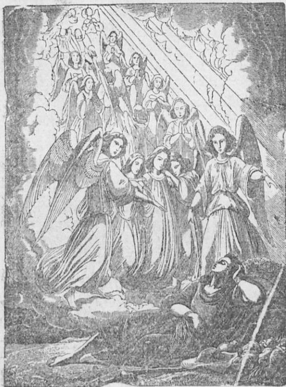
Ἡ κλίμαξ τοῦ Ἰακώβ.