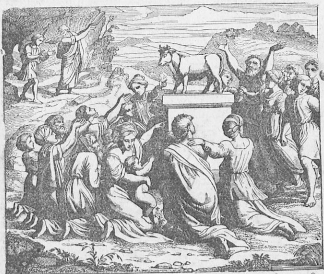
Ὁ χρυσοῦς μόσχος.

Θεοῦ κατέβη ἐκ τοῦ ὄρους. Ὅτε δὲ εἶδε τὰ τελούμενα, ὠργίσθη πολὺ, ἔρριψε κατὰ γῆς τὰς πλάκας τὰς περιεχούσας τὸν δεκάλογον καὶ τὰς συνέτριψεν. Ἐπειτα ἔλαβε τὸν μόσχον, τὸν συνέτριψε καὶ τὸν ἔρριψεν εἰς τὸ πῦρ, τὰ δὲ διασωθέντα ἔξ αὐτοῦ τεμάχια μετέβαλεν εἰς κόνιν, τὴν ὁποίαν ἔρριψεν εἰς τὸ ὕδωρ καὶ ἐπότισε δι' αὐτοῦ τοὺς Ἰσραηλίτας. Ἀφοῦ δὲ ἐφόνησε διὰ