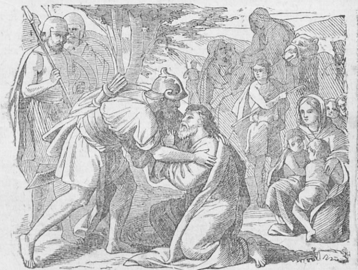
Ὁ Ἡσαῦ ἐναγκαλίζεται τὸν Ἰακώβ.

αίξεται καὶ τὸν καταφιλεῖ, ἐνῶ χύνει ἄρθωνα δάκρυα. Ὁ Ἰακώβ, ἐλθὼν εἰς τὴν Χεβρών, ἐγίνε δευτὸς μὲ μεγίστην χαρὰν καὶ ἀγαλλίασιν ὑπὸ τοῦ πατρὸς τοῦ Ἰσαάκ (1), ὁ ὁποῖος ἀπέθανε βραδύτερον εἰς βαθὺ γῆρας, ἔχων ἡλικίαν ἐλατὸν ὀγδοήκοντα ἔτη, Ἐκ τῶν δύο υἱῶν τοῦ Ἰσαάκ ὁ μὲν Ἰακώβ ἔμεινε εἰς