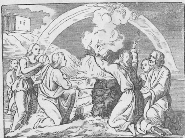
Ὁ Νῶε προφέρει θυσίαν εἰς τὸν Θεόν.

μόνος ἦτο δίκαιος καὶ εὐσεβής. Διέταξε λοιπὸν τοῦτον ὁ Θεὸς νὰ κατασκευάσῃ κιβωτὸν (δηλ. μέγα πλοῖον), νὰ εἰσέλθῃ εἰς αὐτὴν αὐτός, ἡ γυνὴ του, οἱ τρεῖς υἱοὶ του, Σήμ, Χάμ καὶ Ἰάφεθ καὶ αἱ γυναῖκες αὐτῶν, ἀφοῦ παραλάβῃ ἀνὰ τρία καὶ ἡμῖσιν (1) ζεύγη ἐξ ὅλων τῶν ζώων τῶν καθαρῶν καὶ ἀνὰ ἓν ζεύγος ἐξ