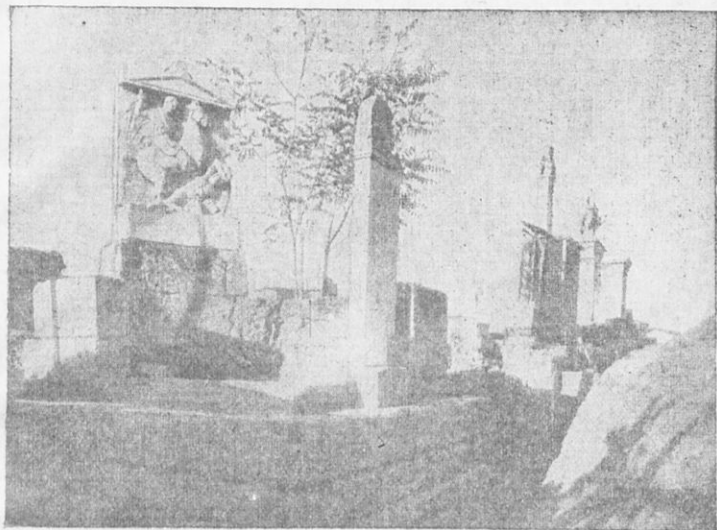
Νεκροταφεῖον μετ' ἐπιτυμβίων στηλῶν. Ὁ ἔξω Κεραμεικὸς τῶν ἀρχ. Ἀθηνῶν (ἅγια Τριάς).