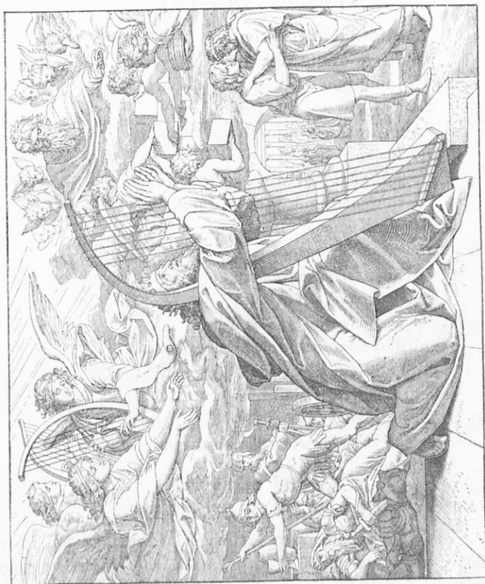
«Ελέησόν με ὁ Θεὸς κατὰ τὸ μέγα ἔλεός σου . . .» (Ψαλ. Ν' 3).