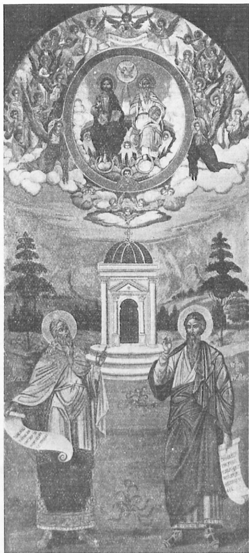
Ἡ Σοφία τοῦ Θεοῦ.