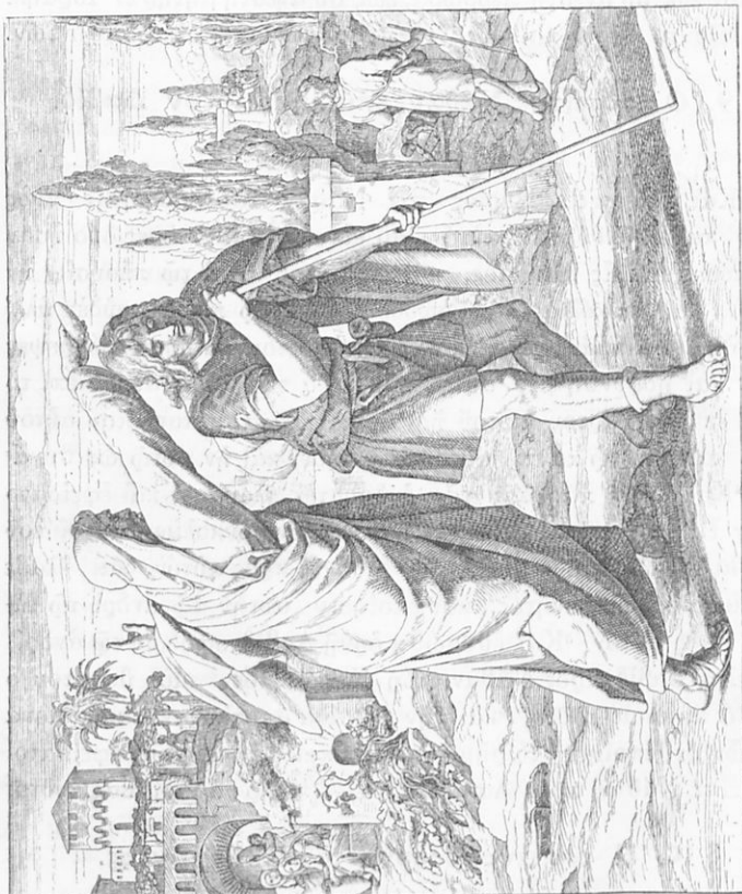
«Καὶ ἔλαβε Σαμουὴλ τὸν φακὸν τοῦ ἐλαίου, καὶ ἐπέχεεν ἐπὶ τὴν κεφαλὴν αὐτοῦ». (Βασίλ. Α' κεφ. 1).