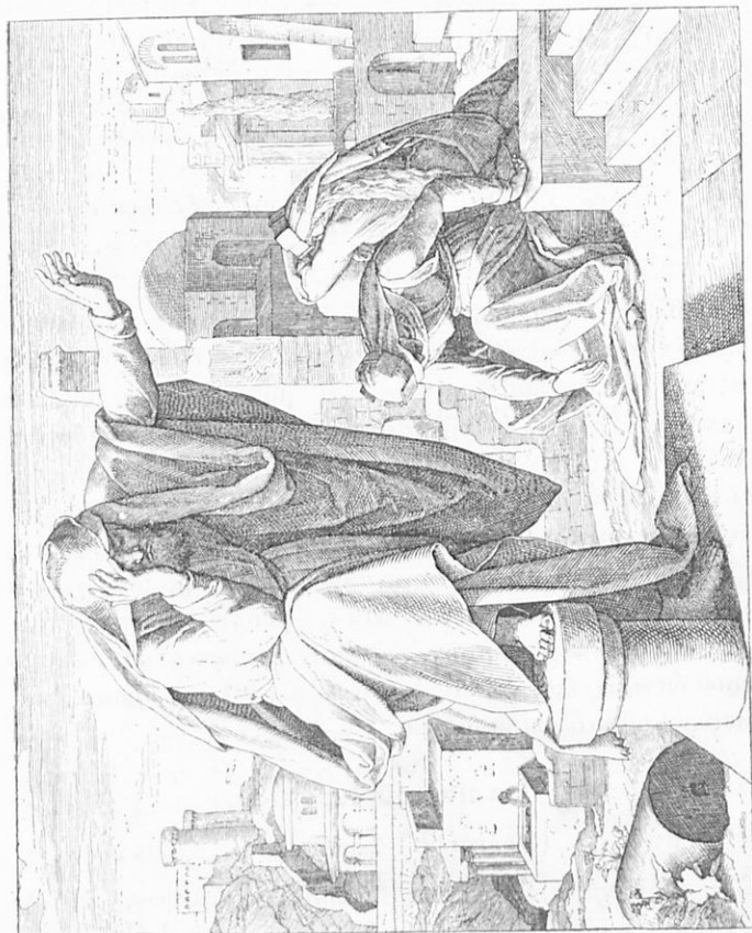
«Ὁσφανοὶ ἐγενήθημεν, οὐχ' ἐπάσχει, πατήρ, μητέρες ἡμῶν ὡς αἱ γῆραι» (Θρηνοὶ Ἱερουμ. ε' 3).