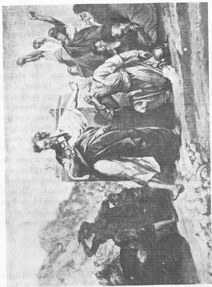
‘Ο Μωϋσῆς κρημνίζων τὰ εἰδωλα.