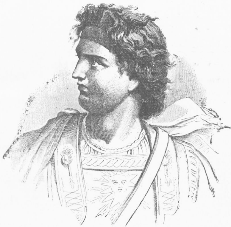
ΑΛΕΞΑΝΔΡΟΣ Ο ΜΕΓΑΣ