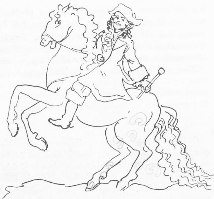
Ὁ ΜΕΓΑΣ ΠΙΕΤΡΟΣ

Μεγάλην ὄθησιν εἰς τὸν πολιτισμὸν τῆς Ρωσίας ἔδω- σαν ὁ τσάρος Πέτρος, ὁ ἐπονομασθεὶς Μέγας, ἀνελθὼν εἰς τὸν θρόνον τὸ 1689.