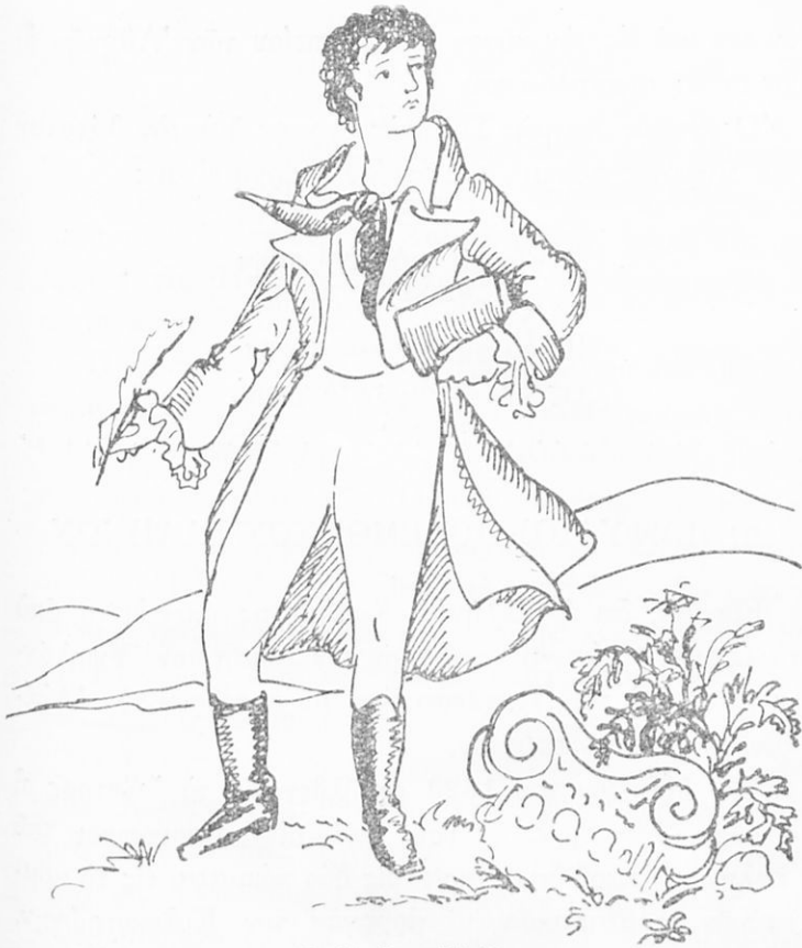
Ὁ Λόρδος Βύρων

Ἀποθνήσκων ὁ Βύρων ἔλεγε : « Ἑλλάς, σοῦ ἔδωκα πᾶν ὅ,τι δύναται νὰ δώσῃ ἄνθρωπος· τὰ πλούτη μου, τὸν καιρόν μου, τὴν ὑγείαν μου καὶ τώρα καὶ αὐτὴν τὴν ζωὴν μου. Εἶθε αἱ θυσίαι μου νὰ συντελέσουν εἰς τὴν εὐτυχίαν σου ».