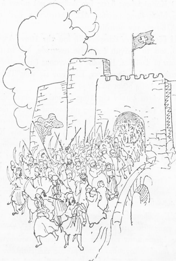
Ἡ ἔξοδος τῆς φρουρᾶς τοῦ Μεσολογγίου

κάμουν ἔξοδον, νὰ διασχίσουν τὰς τάξεις τοῦ ἐχθροῦ καὶ νὰ διασωθοῦν ὅσοι δυνηθοῦν. Διὰ νὰ διευκολύνουν τὴν ἔξοδον, ἤλθον εἰς συνεννόησιν μὲ τὸν Καραϊσκάκη, διαμένοντα εἰς τὸν Πλάτανον μὲ στρατόν, νὰ ἐπιτεθῇ κατ' αὐτὸς ἔξωθεν κατὰ τῶν Τούρκων.