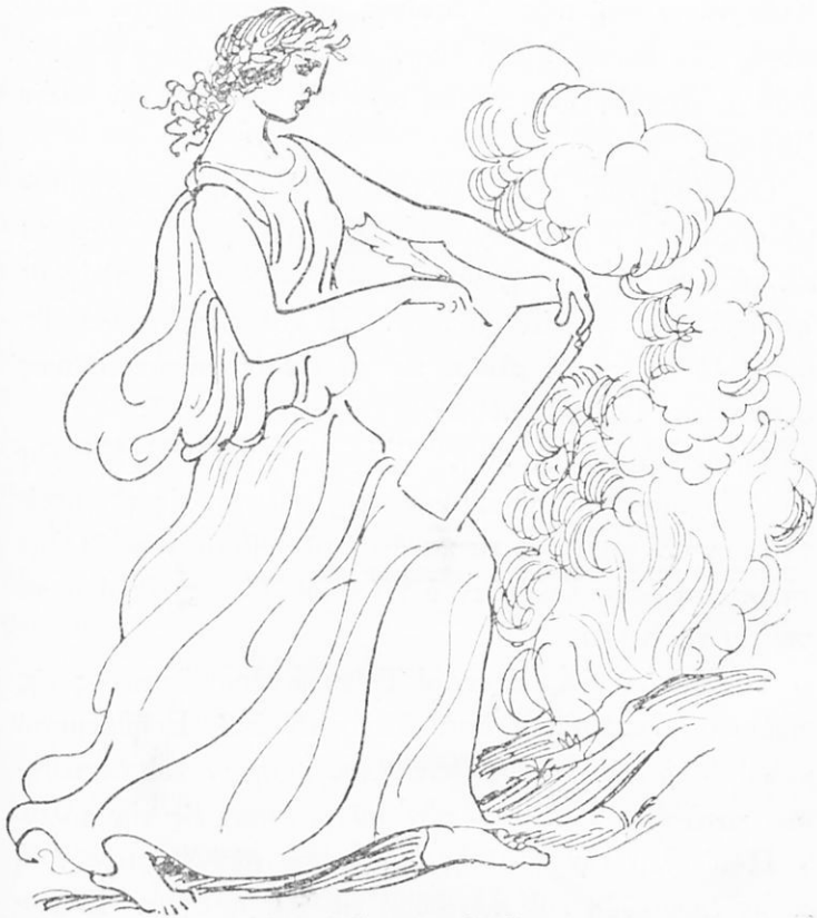
Ἡ δόξα τῶν Ψαρῶν

κτικόν, ἠτοιμάζετο νὰ ἐπέλθῃ κατὰ τῆς Ἑλλάδος· ὁ Σουλτάνος ἠτοίμαζε στόλον καὶ στρατὸν καὶ οἱ Ἕλληνες ἐφιλονεῖκουν διὰ τὰ κόμματα.