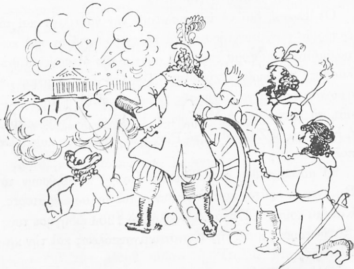
Ἡ καταστροφή τοῦ Παρθενῶνος

λιόρκει τὴν Ἀκρόπολιν τῶν Ἀθηνῶν, κατεχομένην ὑπὸ τῶν Τούρκων. Μία ὄβις ἔπεσεν εἰς τὸν Παρθενῶνα, τὸν ὁποῖον οἱ Τούρκοι εἶχον μεταβάλῃ εἰς πυριτιδαποθήκην. Ἐπῆλθε τρομερὰ ἔκρηξις καὶ ὁ ὠραῖος ναὸς κατὰ τὸ πλεῖστον ἐκρημνίσθη. Ἦλθεν ἐποχή, κατὰ τὴν ὁποῖαν οἱ Ἐνετοὶ κατεῖχον ὁλόκληρον τὴν Πελοπόννησον, - τὴν Κ