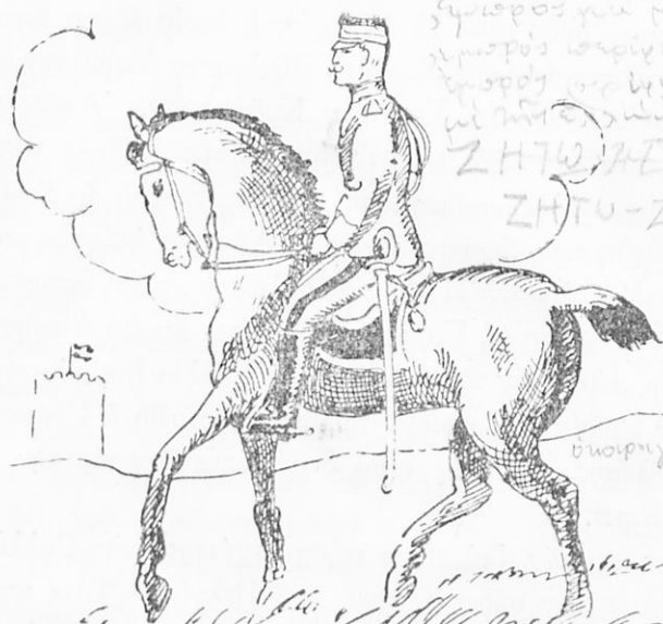
*Ο Βασιλεὺς Κωνσταντῖνος

ξίαν της, ὅτι εἶχε κερδίσει κατὰ τὸν συμμαχικὸν πόλεμον ἐναντίον τῆς Τουρκίας.