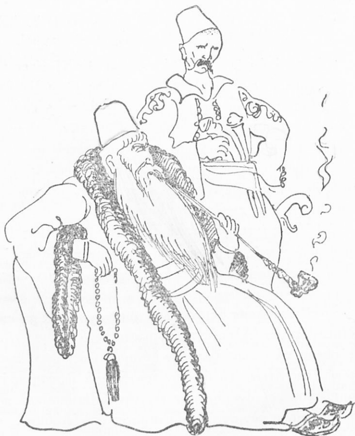
Ὁ Ἄλῃ Πασᾶς

Ἄλβανικὸς στρατός, ἐπολέμησαν γενναϊότατα καὶ ἀπέκρουσαν τοὺς Ἄλβανούς. Αἱ γυναῖκες τῶν Σουλιωτῶν ἔφερον εἰς τοὺς μαχομένους τροφίμα καὶ πολεμεφάρδια ἀπὸ τὰ χωρία των καὶ ὅταν ἔβλεπον κουρασμένους τοὺς ἄνδρας των, ἐλάμβανον καὶ αὐταὶ μέρος εἰς τὸν πόλεμον.