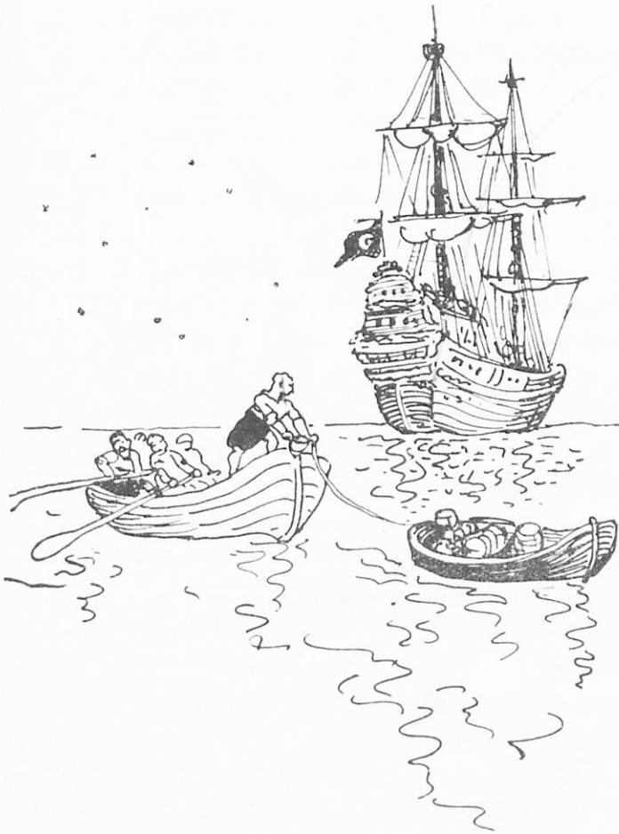
Ἡ πυρπόλησις τῆς Τουρκικῆς ναυαρχίδος

τῶν Τούρκων, καὶ ἐξημέρωνε τὸ Μπαϊράμι, δηλ. τὸ Πάσχα τῶν Τούρκων (6—7 Ἰουνίου).