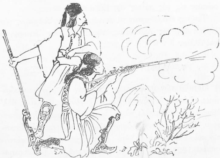
Οἱ κλέφτες ἐγυμνάζοντο

Οἱ Τοῦρκοι μὴ δυνάμενοι νὰ τοὺς ὑποτάξουν, ἐσυνθη- κολόγουν μὲ αὐτοὺς καὶ τοὺς ἀνέθετον τὴν φύλαξιν τῶν ὄρεινῶν μερῶν καὶ μάλιστα τῶν στενοποριῶν. Οἱ συνθη- κολογοῦντες κλέφτες ἐλέγοντο ἀρματωλοὶ καὶ τὰ μέρη, τὰ ὁποία ἐφύλαττον, ἐλέγοντο ἀρματωλίκια.