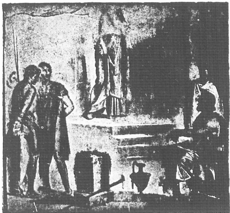
Ὁ Ὀρόντης καὶ ὁ Πυλάδης εἰς τὴν χώραν τῶν Ταύρων (Τοιχογραφία Πομπηίας)