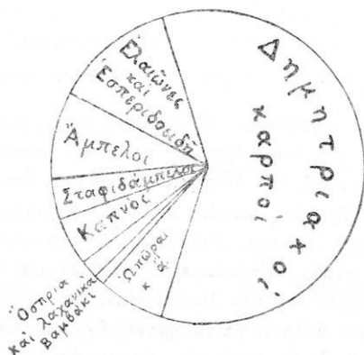
Εἰκ. 1. Σύγκρισις τῶν παραγομένων γεωργικῶν προϊόντων τῆς Ἑλλάδος κατ' εἶδη.

ἀπὸ τὸ ἐξωτερικόν (κυρίως ἐκ τῆς Ἀμερικῆς καὶ τῆς Αὐστραλίας). Τοῦτο κυρίως προέρχεται ἐκ τοῦ ὅτι ἡ κατὰ στρέμμα ἀπόδοσις τοῦ σίτου ἐν Ἑλλάδι εἶνε ὀλίγη (62 χιλιογρ.) ἐνῶ ἄλλων χωρῶν ἢ μέση ἀπόδοσις εἶνε 118 χιλιογρ. Μόνον κατὰ τὰ τελευταῖα ἔτη διὰ τῶν κυβερνητικῶν φροντίδων ἡ παραγωγή ἤρκεσε νὰ διαθρέψῃ 4.600.000 ἀνθρώπους· καὶ ἐκ τοῦ ἐξωτερικοῦ ἐχρηιάσθη σίτος ἀκόμη μόνον διὰ 2 ἑκατομ., καταβάλλεται δὲ σὴ μερον προσπάθεια ὅπως ἡ Ἑλλὰς καταστῇ αὐτάρκης.