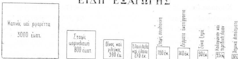
Εἰκ. 2. Ἀξία εἰς δρ. τῶν κατ' ἔτος εἰσαγομένων προϊόντων τῆς Ἑλλάδος