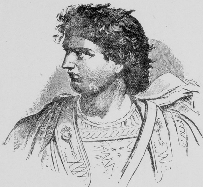
ΑΛΕΞΑΝΔΡΟΣ Ο ΜΕΓΑΣ