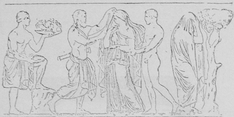
Ἡ Θυσία τῆς Ἰφιγενείας.

Τὸ τελευταῖον μέρος τῆς τραγωδίας (1552-1629) καταλήγον εἰς τὴν ἔξοδον τοῦ Χοροῦ καλεῖται Ἐξοδος. Εἶναι δὲ ἡ τελευταία πράξις τῆς τραγωδίας, ἡ ὁποία περιέχει τὴν καταστροφὴν, ἐν ᾗ ἡ πρᾶξις τε- λειῶς περαίνεται διὰ τῆς λύσεως τῆς δραματικῆς πλοκῆς.