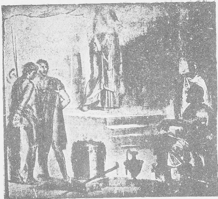
Ὁ Ὀρέστης καὶ ὁ Πυλάδης εἰς τὴν χώραν τῶν Ταύρων (Τοιχογραφία Πομπηίας)